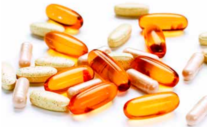
Olej z kryla omega 3