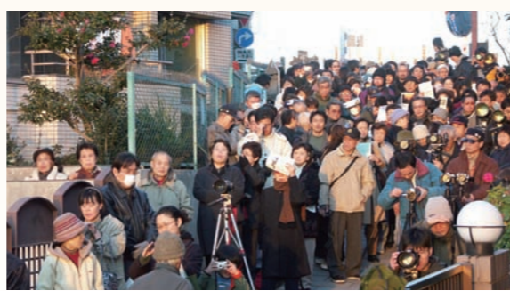
日暮里富士見坂のダイヤモンド富士(2011年1月30日) ダイヤモンド富士とは太陽が富士の頂に沈むときの輝きをいいます。稜線を転がるように落ちる太陽と、日没後にくっきりと浮かぶ富士のシルエット。その美しさをぜひご覧ください。日暮里富士見坂では、1月下旬(29日~31日頃)と11月中旬(11日~13日頃)の年に2回、富士山の頂に太陽が沈むのを見ることができます。