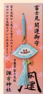
上) 富士山をかたどったお守り 左) 諏方神社