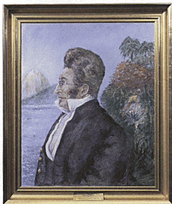
Portræt af P. W. Lund. Malet efter en ældre tegning ca. 1990 af slægtningen P. V. Lund. Botanisk Museum.

egen opfattelse fremsat 30 år tidligere i de allerede nævnte artikler.