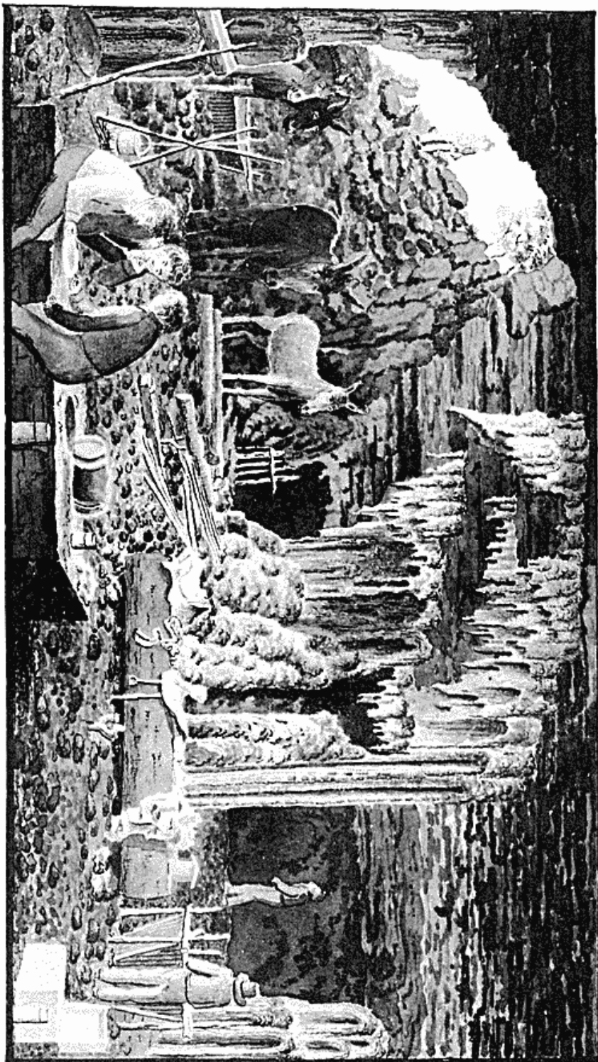
Lappra do Mosquito