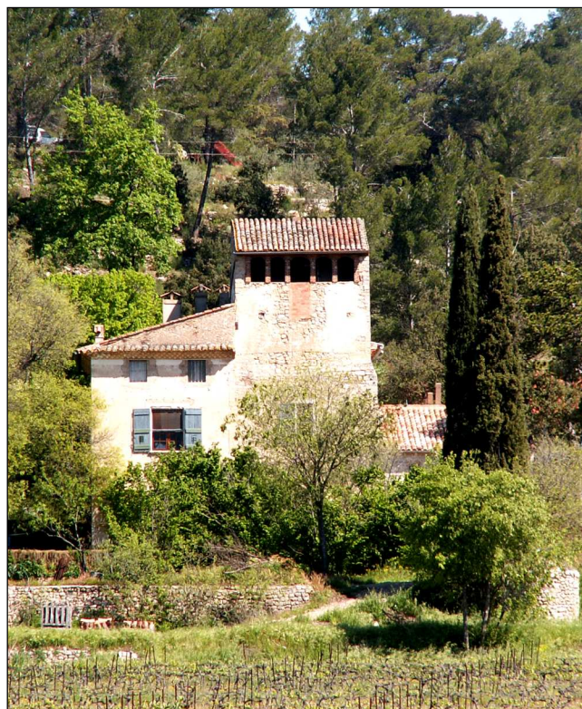
Fig. 2 : Le domaine des Espéluques correspond à la description d'Henseling. Il se trouve en bordure de la plaine alluviale de l'Argens

En pays calcaire, où les cavités naturelles abondent, le terme de Speluque a suscité, comme vu précédemment, de nombreuses légendes. En réalité, Notre-Dame des Speluques a été édifiée sur un important site gallo-romain, comme on en trouve plusieurs dans la région. On y a trouvé de nombreuses traces datées du I e au VII e siècle, en particulier, les restes d'un aqueduc amenant l'eau de la Source de Saint-Martin à Cotignac. Certains pensent que la chapelle a été élevée à proximité ou sur un ancien temple romain.