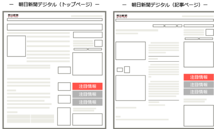
朝日新聞デジタルスマホ最適化サイト (トップページ・記事ページ)

朝日新聞デジタル（PC版）とスマホ最適化サイトの両方に配信されるメニューです。常に表示され、1週間の掲載期間では全メニューの中で最大のインプレッション数を誇ります。