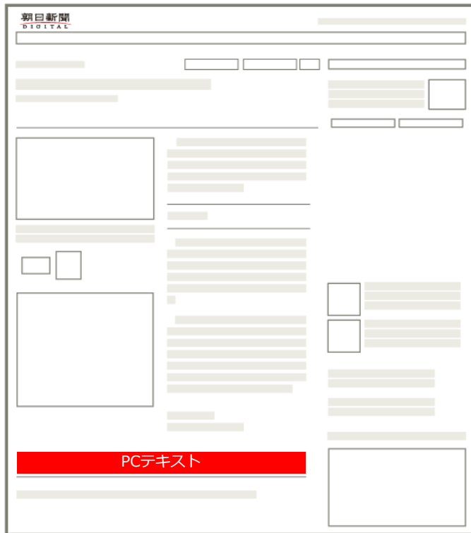
— 朝日新聞デジタル（記事ページ） —

朝日新聞デジタル（PC版）のカテゴリトップ、記事ページに掲出されるテキスト広告です。常に表示され、インプレッション数も多いメニューです。