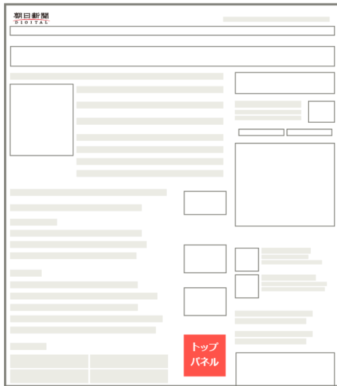
— 朝日新聞デジタル（トップページ） —

朝日新聞デジタル（PC版）のトップページで常に表示される、画像とテキストを組み合わせた広告枠です。編集コンテンツのおすすめ特集と同じ並びに掲出される、ネイティブな広告枠となっています。