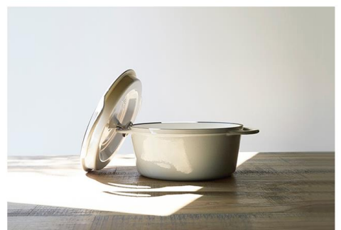
パーミキュラ オープンポットラウンド 22cm【ナチュラルベージュ】

パーミキュラは、機密性の高さによって「無水料理」を可能にした鍋。創業82年の愛知県の老舗町工場が手がける、「メイドインジャパン」にこだわったブランドです。