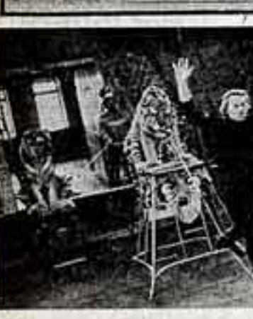
Поиски и находки