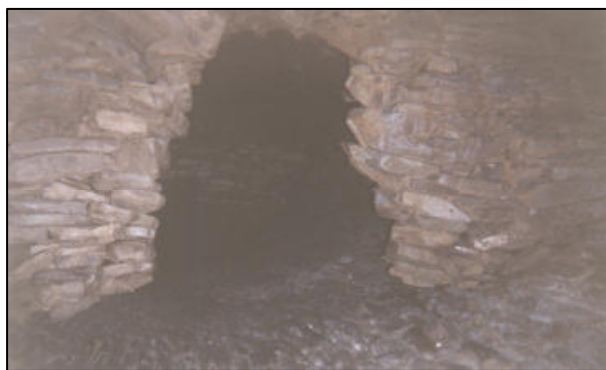
Wnętrze piwnicy dworskiej.

ale zrezygnował. Do chwili obecnej zachowały się resztki stajni, stodoły i dworu. Prócz tego piwnica znajdująca się we dworze.