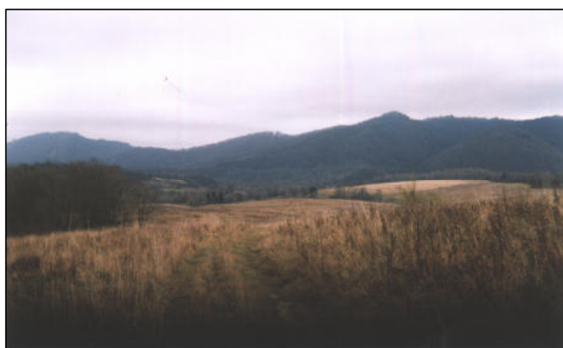
Widok na Otryt.

Tereny wsi Tworylne są niezamieszkane i należą do lasów państwowych.