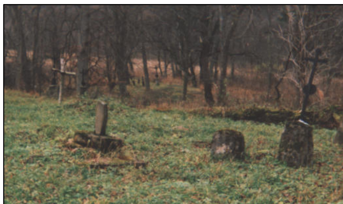
Niektóre nagrobki przetrwały do dzisiejszych czasów

Podzielony na dwie części, usytuowany po obu stronach drogi, około 600m na południowy wschód od cerkwi. Zachowało się do dzisiaj kilka nagrobków i jeden grobowiec.