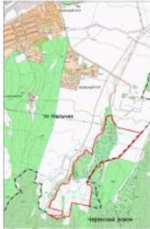
Схема размещения проектной территории

городской округ Нальчик, Исаитовское с/поселение: 07.09.0103038, 07.09.0103056, 07.09.0103039, 07.09.0103047, 07.09.0103040, 07.09.0103048, 07.09.0103042, 07.09.0103050, 07.09.0103043, 07.09.0103051, 07.09.0103044, 07.09.0103053, 07.09.0103046, 07.09.0103055, 07.09.0103044