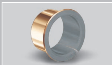
带铜质背衬的免维护法兰衬套