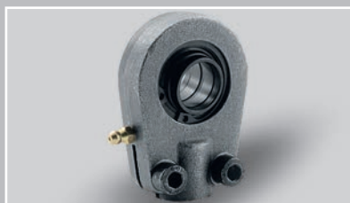
用于液压缸的杆端，免维护和需维护 (Ø 12 – 200 mm)