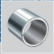
INA 金属-高分子复合材料 (MPC) 滑动轴承, 免维护或低维护