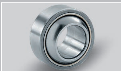
采用 PTFE 复合材料的径向关节轴承 (Ø 6 – 30 mm)