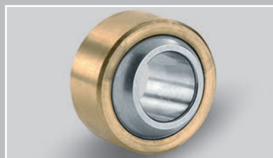
采用 PTFE 箔片的径向关节轴承 (Ø 6 – 30 mm)