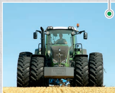
... 拖拉机车轴及商用车辆的离合器杆