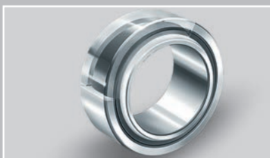
采用 ELGOGLIDE 技术的径向关节轴承 (Ø 17 – 300 mm)：理想的轴承重量与负荷能力比