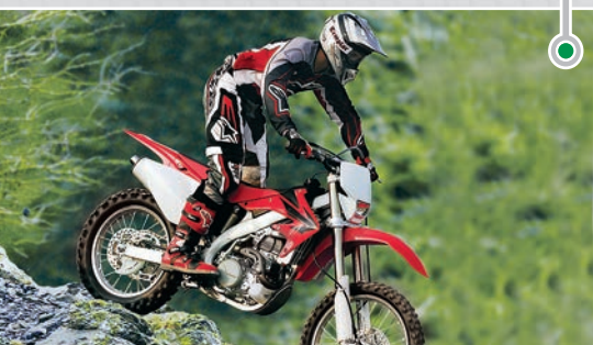
... 适用于越野摩托车减震器中使用的液压缸