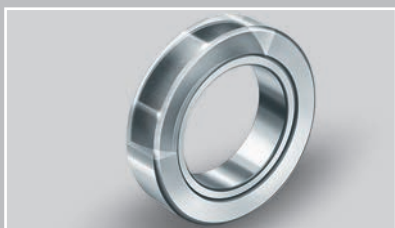
采用 ELGOGLIDE 技术的角接触关节轴承 (Ø 25 – 200 mm)：特殊设计，针对复合载荷