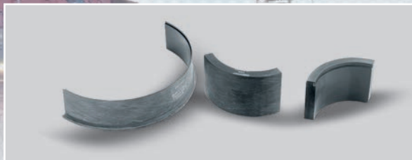
采用ELGOTEX 技术的分段轴承：创新滑动材料 – 不仅适用于起重吊设备