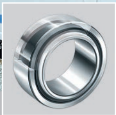
INA 关节轴承和杆端轴承, 免维护和需维护

舍弗勒集团以INA品牌生产和经销品种丰富的优质滑动轴承, 其中包括采用 ELGOTEX 和ELGOGLIDE 技术的衬套, 以及金属-高分子复合材料的滑动轴承。当然, 我们还供应久经考验的ELGES 关节轴承系列产品。凭借如此丰富的产品组合, 我们能够向您提供合适的滑动轴承, 几乎可以满足您的所有应用。