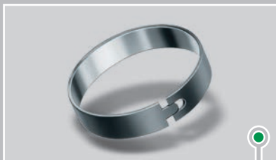
外部有涂层，并带有特殊缝隙接头的轴衬...

部检测设施与实验室开展理化分析。他们能够借助我们这个全球性集团公司的技术资源和专长，从而为客户创造重大收益。