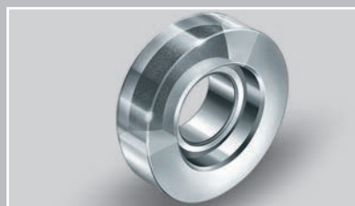
采用 ELGOGLIDE 技术的轴向关节轴承 (Ø 10 – 360 mm)：可与径向轴承结合使用