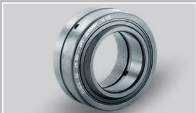
品种丰富的需维护全钢径向关节轴承 (Ø 6 – 1000 mm)