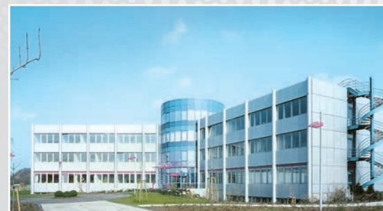
设在德国施泰因哈根的舍弗勒工厂