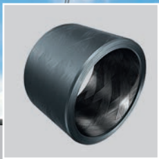
采用 ELGOTEX 技术的INA滑动轴承, 亦可作为分段轴承供应