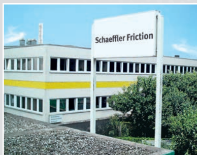
设在德国哈姆/西格的舍弗勒摩擦及滑动材料工厂