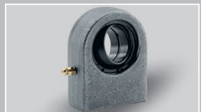
带焊接面的杆端，定位销可选 (Ø 10 – 120 mm)