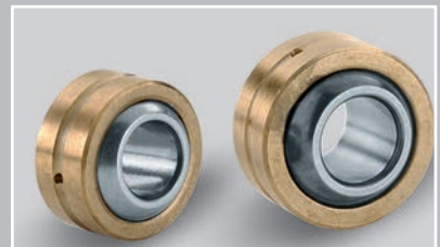
钢-铜径向关节轴承，需维护 (Ø 5 – 30 mm)