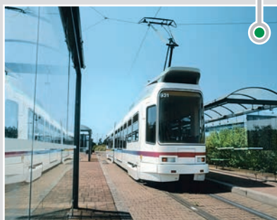
... 有轨电车的中间连接件