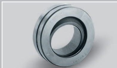
全钢角接触及轴向关节轴承，需维护 (Ø 10 – 200 mm)