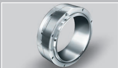
采用 ELGOGLIDE 技术的大型关节轴承 (Ø 320 – 1000 mm)：品质卓越，寿命超长

采用 ELGOGLIDE 技术的关节轴承：我们的 ELGOGLIDE 品牌产品使用基于 Teflon 纤维的高性能和免维护滑动材料。这些产品适应接触压力 1 至 300 MPa 的动态负荷，尤其适用于要求最少摩擦的应用。