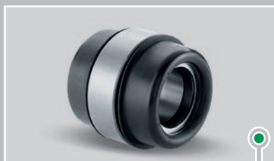
带波纹管的关节轴承，用于...