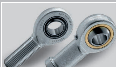
符合DIN ISO 12240-4标准的杆端，免维护和需维护 (Ø 5 – 80 mm)