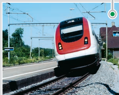
... 稳定轨道车的车体（倾斜技术）