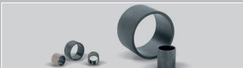
采用 ELGOTEX 技术的免维护衬套 (外径24 - 1400 mm, 宽度 15 - 2000 mm)