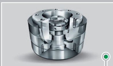
容易装配的特殊关节轴承，用于...

状态监控是一种可靠的方法，可及早察觉机器受损，防范计划外停机。我们可以帮助您找到最适合自身机器的监控方案，其中包括通过我们的已经认证“远程服务中心”提供远程监控方案。