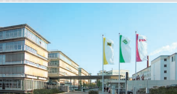
设在德国黑措根奥拉赫的舍弗勒集团总部