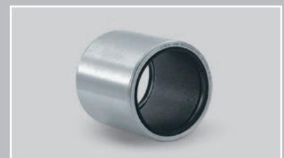
采用ELGOGLIDE技术的免维护高性能衬套 (Ø 30 - 1000 mm)