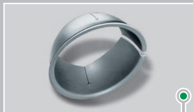
轴承座的球形轴套，用于...