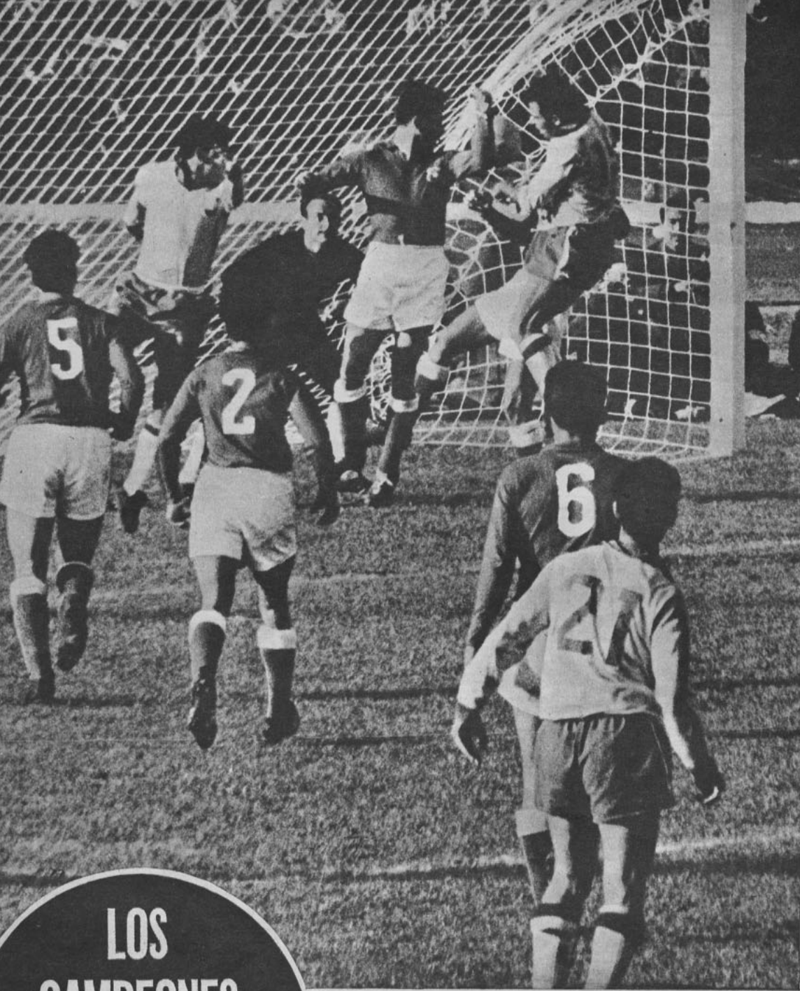
CABECEA VAVA. — El endiablado Garrincha y el centro forward Vavá llegan hasta la valla de Escuti, pese a los esfuerzos de la defensa chilena. El guardavallas nacional no sale a cortar la combinación del "scratch" y su atraso es bien aprovechado por Vavá que cabecea y convierte.