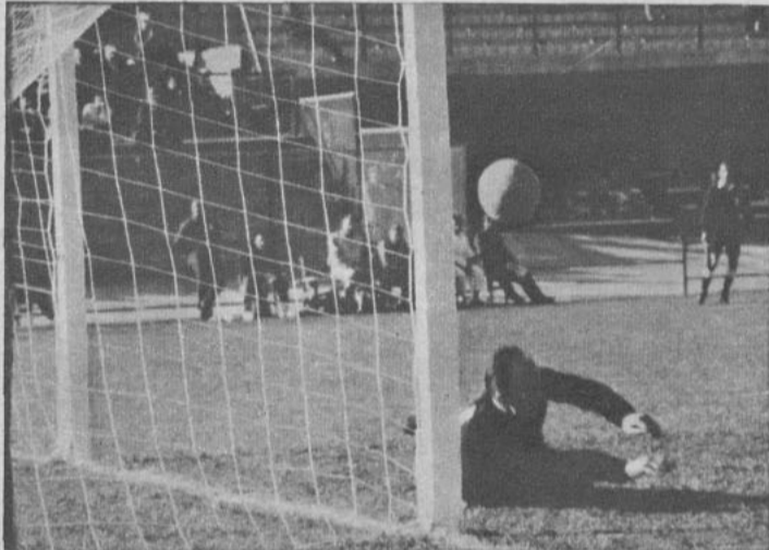
SCHROIF INVICTO. — El brillante arquero checo Schroif detiene en el suelo un lanzamiento de Didi desde fuera del área, concediendo tiro de esquina. El cero a cero de Checoslovaquia y Brasil se debió a la buena faena del guardavallas.