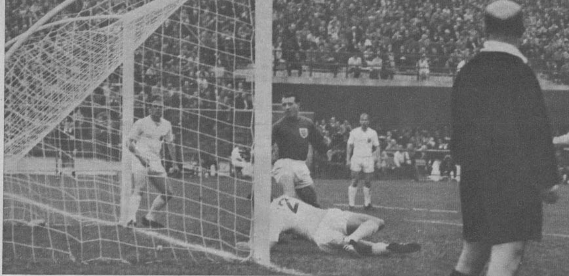
¡GOL DE VAVA! — Ante la alegría de Amarildo (20), se produce el gol de cabeza de Vavá, quien no aparece en la foto. Springett mira el balón, y lo propio hacen Armfield y Wilson, sin poder detener su trayectoria hacia las mallas. Gran actuación cumplió el "once" brasileño.

A su turno, Inglaterra le dio elasticidad a su 4-2-4, y permitió el juego en su campo, con vista al contraataque. El arquero Springett y el fornido zaguero Moore eran garantía para ese padrón. Pero la eficiencia europea se rindió ante el excelente estado físico de los brasileños. Los ingleses se cansaron y la marcación se fue haciendo más liviana para el "scratch". El gol de Garrincha, a los 31 minutos de juego, había sido empatado por una jugada igual de notable, en que intervinieron el alero Douglas y el forward Hitchens, que remató una jugada del primero. Todo esto en la primera etapa. Después del descanso, arremetieron los campeones del mundo. Fantástico gol de cabeza de Vavá, después que el arquero inglés rechazó con los puños un disparo de Didi. Y por último: otra arremetida de Garrincha con chute de 30 metros.