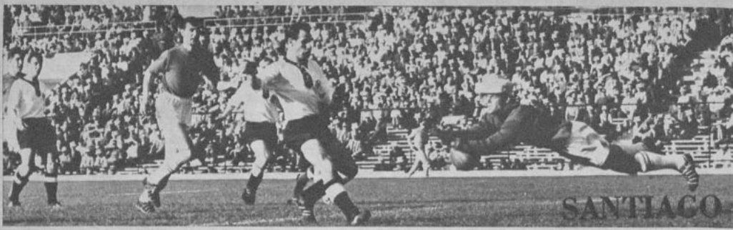
SE LUCE ELSENER.— El buen meta de los suizos es sorprendido por la cámara en el momento en que se lanza a embolsar una pelota que puso general peligro en su arco, ante una arremetida de los delanteros germanos. El arquero fue siempre el más alto valor suizo.