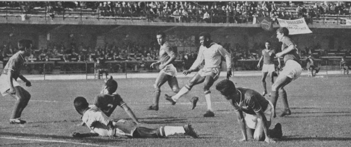
ACCIONA PELE.— En el encuentro con México pudo verse la calidad excepcional de Pelé, el centrodelantero de los campeones del mundo. En la escena aparece finalizando, sin éxito, un ataque, rodeado de defensores aztecas. Fue un duro debut para Brasil y una meritoria faena del equipo azteca, que resultó al final una revelación agradable del Mundial de Chile.