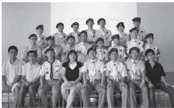
Photo with the scouts of PLK83 after the scout investiture ceremony 2007 (4 th from the right of the 1st row)