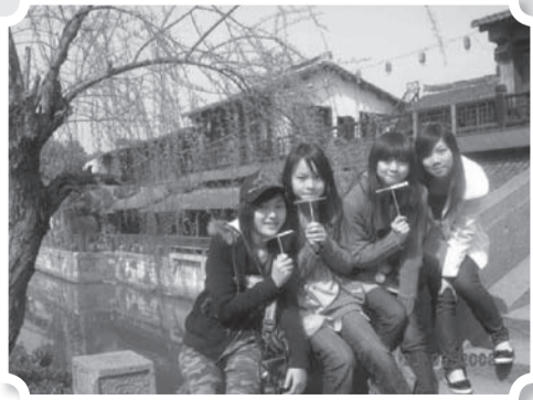
上海, 一個既時尚又能保留昔日情懷的城市, 在一些小街依然可以嘗到中國傳統風味