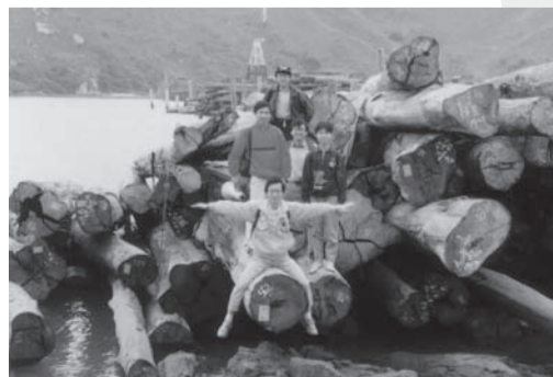
孔子云：「知者樂水，仁者樂山」，許校長從山水中悟出許多人生哲理

「人生的發展，並不只在吸取知識，還在於身體力行。在運動中，我學到如何與人相處，心境隨之更加開闊，身體機能也愈來愈好。」許校長道。