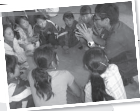
我們與當地小學生玩遊戲