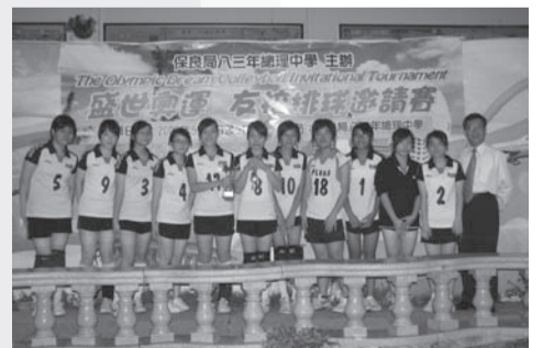
我校積極推動體育運動，去年邀請了一些友校參與「盛世奧運—友校排球邀請賽」，實踐了「同一世界，同一夢想」的理想

「要讓更多人明白此理，這是我們體育教育工作者的目標，是我們『體育人』的理想。縱使長路漫漫，我還是會向終點一直地跑，永不放棄。」