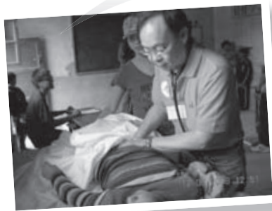
義工醫生為當地學生作身體檢查