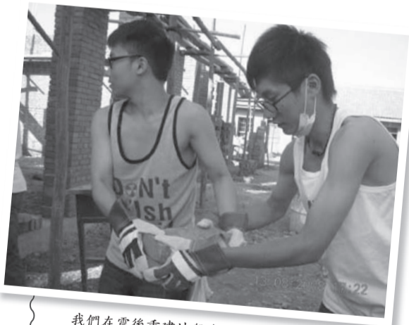
我們在震後重建地盤參與義務勞動

飛機起飛的一刻我想：這時候，山區的小朋友大概仍在田上努力耕種，又或是在黑暗的窖洞中溫習。他們將會繼續努力地為生存而掙扎，為夢想而奮鬥，而我也該加倍努力。在此，我為他們獻上最深的祝福。