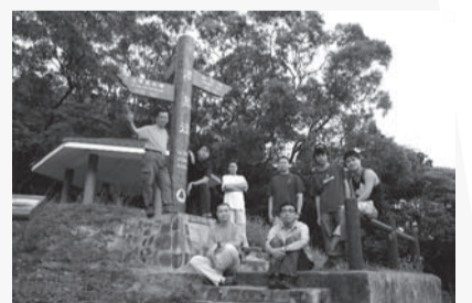
本年中秋，許校長(後排左一)與舊學生夜行柏架山後，清晨留影