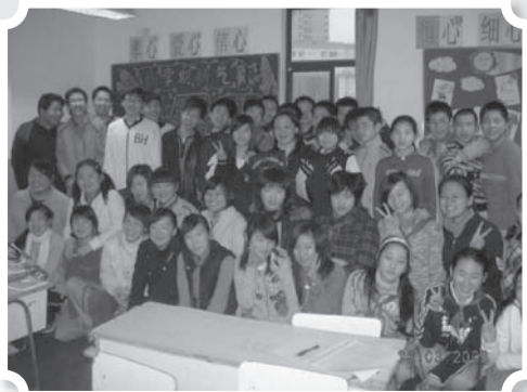
「海內存知己, 天涯若比鄰」 縱是分處兩地, 我們仍可以電郵維繫友情

一下車, 便看到南洋中學的頂樓裝置了風力發電的裝置。茶會後, 我們到了一間實驗室, 認識了奚老師。奚老師示範了多個有趣實驗, 更引領我們參觀他個人的發明成果室。六十八高齡的他熱愛教學, 喜歡探新, 他把發明應用到生活中, 所以校園的周圍都能看到他的發明。奚老師鏗而不捨的研究精神, 實在令人敬佩。此行能認識到這位國寶級老師, 令我明白孔子所言「發憤忘食, 樂以忘憂, 不知老之將至」的真意; 如果我們對每件事都投入去做, 那確是人生一大樂事。