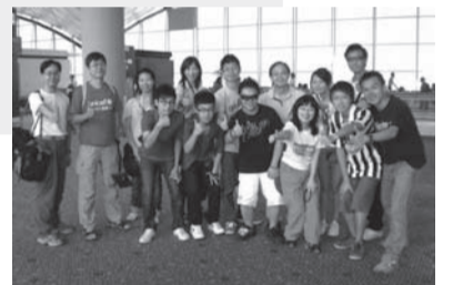
香港義工踏上征途

最後, 你們要相信每一個人都可以是領袖, 不要小看自己; 每個人都是國家隊的一員, 都可以協助中國邁向冠軍; 小如捐血和省水節電, 同樣可以令社會變得更好!