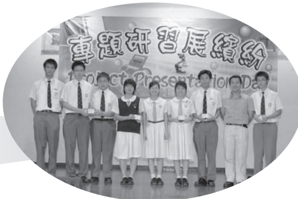
Our old boy serves his alma mater with pride