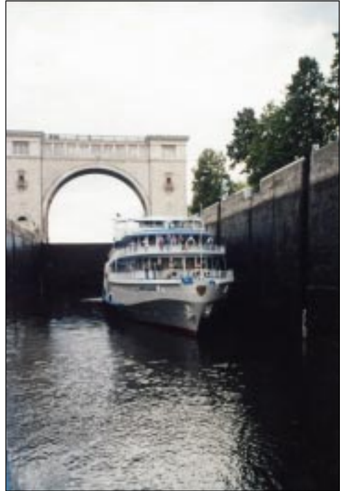
Шлюз канала Москва — Волга.

8 августа 1941 года Георгий Эфрон записывает в дневнике: «Нахожусь на борту «Александра Пирогова», который плывёт по каналу Москва — Волга. После трагических дней — трагических, главным образом, из-за отсутствия конкретных решений и почти фантастических изменений этих решений, после кошмарной погрузки на борт мы, наконец, отчалили. ... Всего путешествие продлится 8 дней. Окончательное место назначения город Елабуга, на реке Каме. ... Довольно паршиво, но всё, что я мог