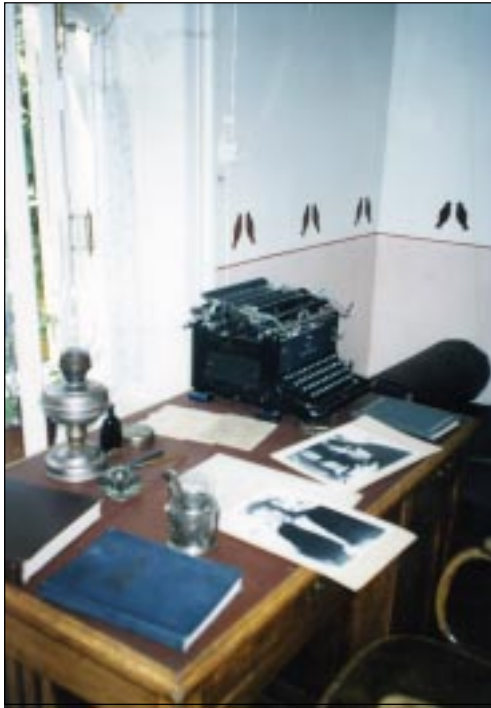
В Доме-музее Б. Пастернака в Чистополе.

... Много интересных экспонатов в Чистопольском музее уездного города, к примеру, велосипед, сделанный местным умельцем только из деревянных деталей!