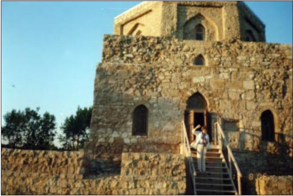
В древнем Болгаре.

Великий Болгар, возникший в IX-X веках, был экономическим, политическим и культурным центром Волжской Булгарии. Здесь находилась ставка хана, чеканились монеты, бурно развивались ремёсла... В пригород Болгара под названием Ага-Базар приезжали купцы из Средней Азии, Ирана, Византии, Китая.