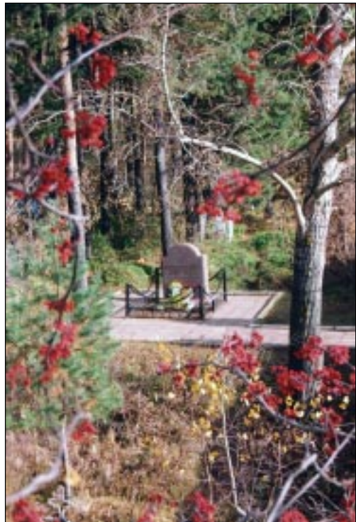
Могила Марины Цветаевой в Елабуге.