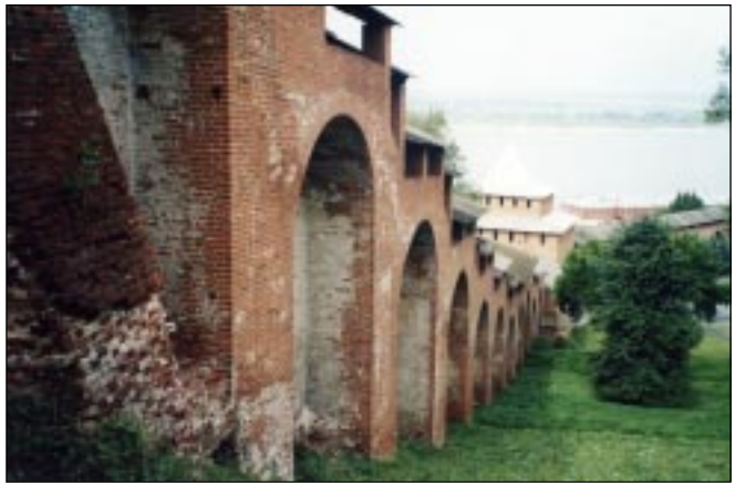
Стены Новгородского кремля.

“Петербург — голова, Москва — сердце, а Нижний Новгород — карман России”, — так говорили о знаменитых Нижегородских ярмарках. В начале 20-го века с 15 июля по 15 августа в этот город ежегодно