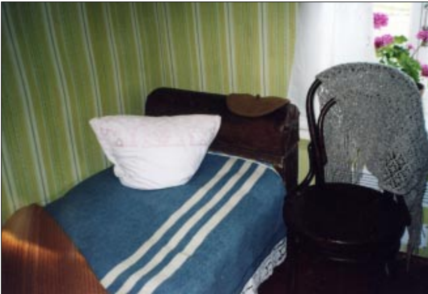
В Доме памяти М. Цветаевой. Здесь она жила последние 10 дней своей жизни.

М. Цветаева писала о каком-то германском городке, мол, если бы здесь жил, или родился, или хотя бы останавливался Гёте, этот городок обрёл бы смысл. “Марина Цветаева оправдала Елабугу”, — прозвучало на конференции.