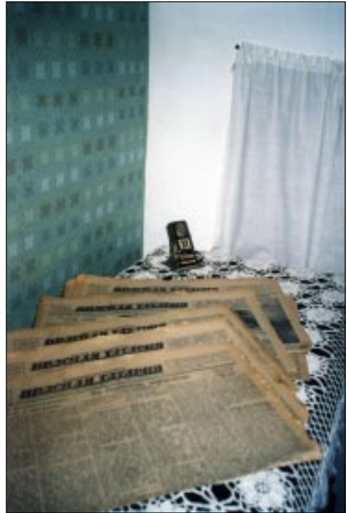
В Доме памяти М. Цветаевой. Календарь остановлен 31 августа 1941 года.

Идёшь, на меня прохожий, Глаза устремляя вниз. Я их опускала — тоже! Прохожий, остановись!