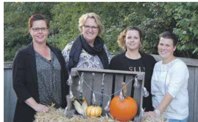
de organisatie van de najaarsmarkt: een deel van de Ouderraad van de school.

Meteen om zes uur was het al gezellig druk en even later was er in de Schoolstraat al geen parkeerplek meer vrij. Het geeft aan dat er heel wat mensen op de najaarsmarkt afkwamen: kinderen, ouders en ook grootouders. Ze genoten allen en spraken van veel afwisselingen op de najaarsmarkt. Naast de kramen met divers verkoopwaar was er voor kinderen ook de mogelijkheid zich te laten schminken en liet menig een de gebakken cake en taart die ouders van leerlingen hebben gemaakt goed smaken. (Week in Week uit / Gerry Grave)