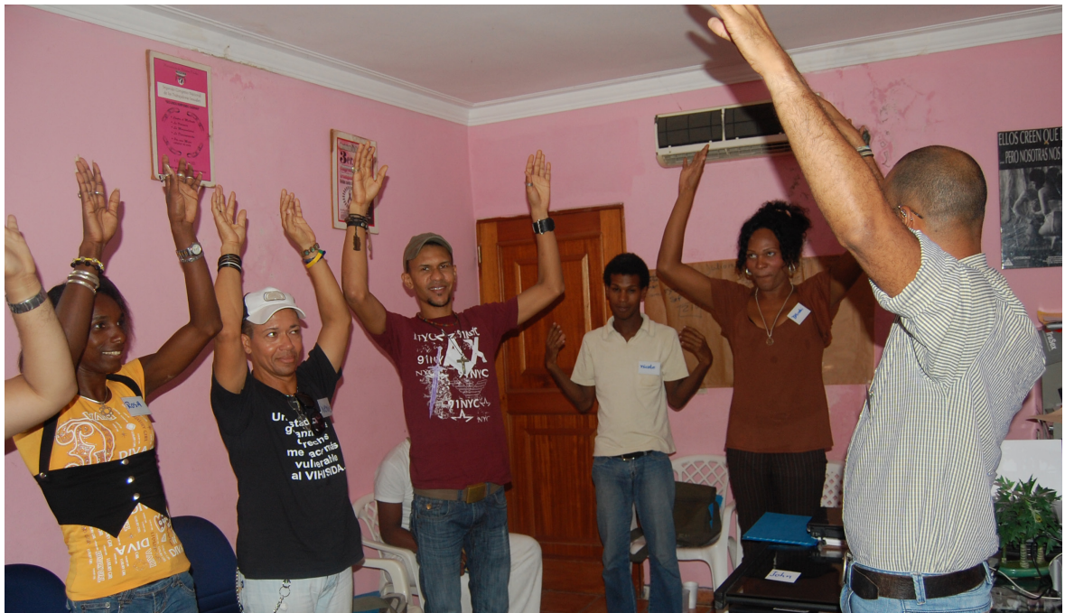
Los miembros de COIN participan en un taller para educadores de pares en Santo Domingo, República Dominicana.