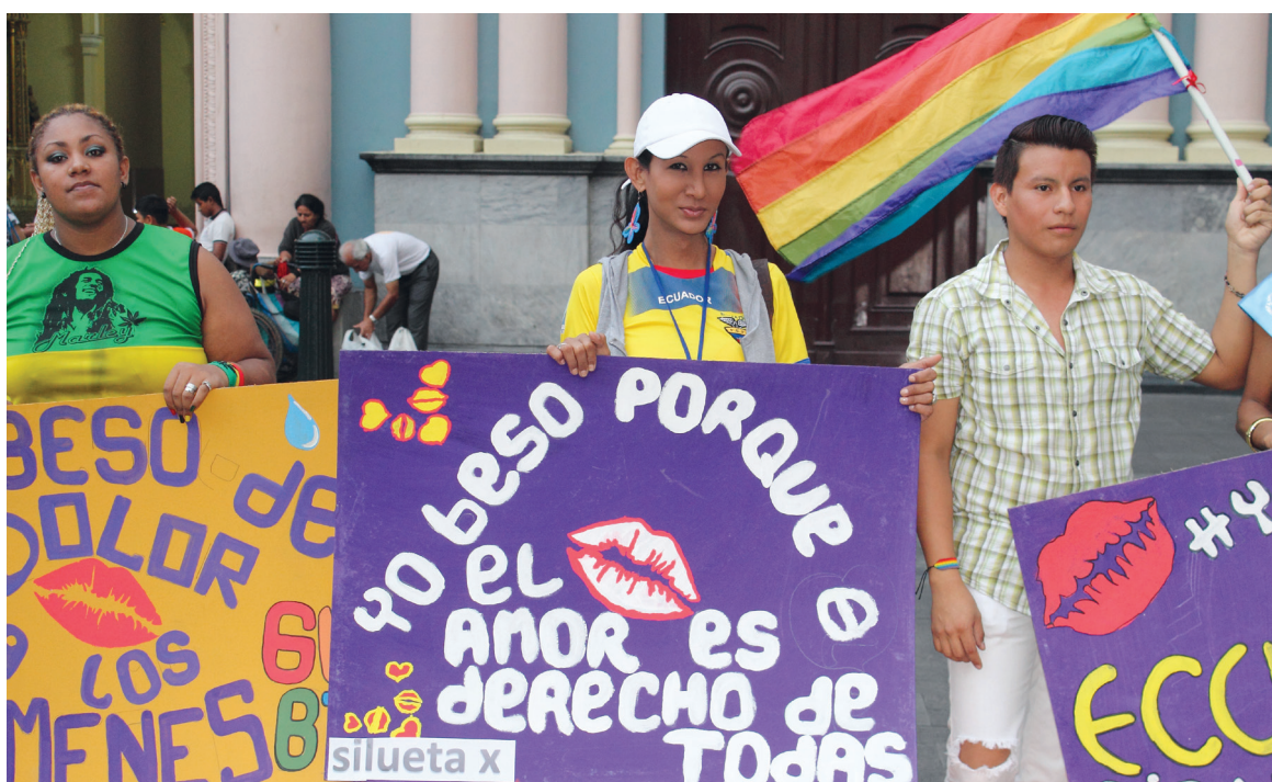
Los miembros de Silueta X durante un besaton que organizaron el Día Internacional contra la Homofobia y la Transfobia