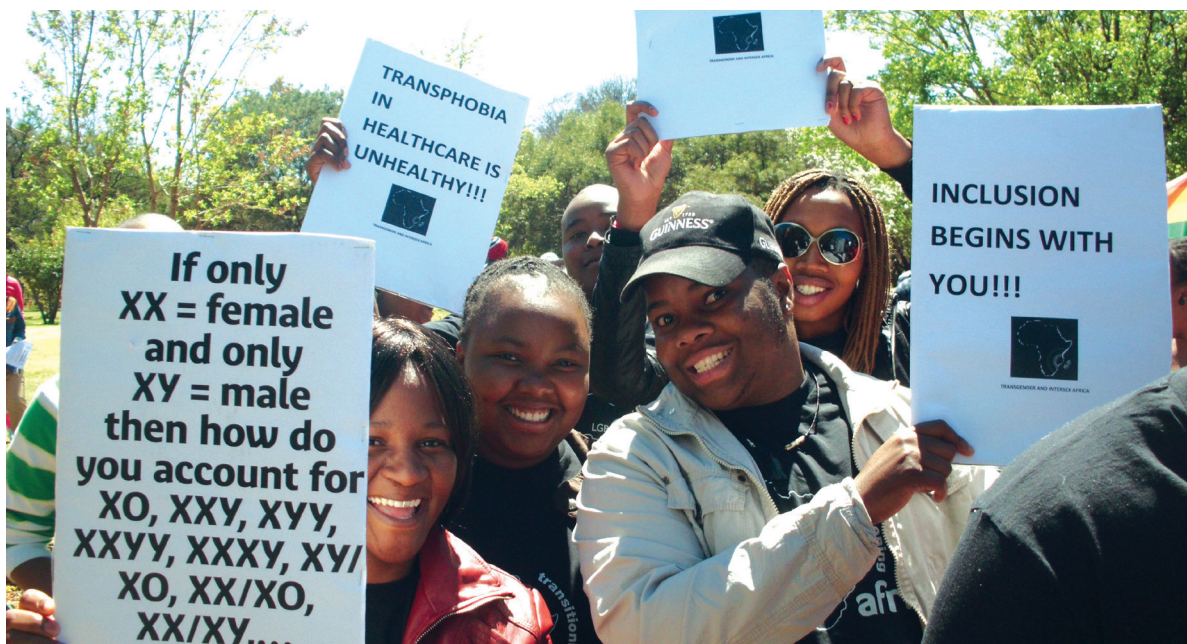
Miembros de TIA celebran orgullo en Soweto, Sudáfrica.