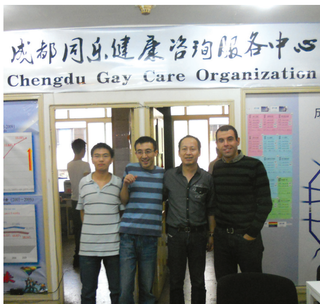
Los miembros de Chengdu Tongle en sus oficinas

Años de trabajo con población LGBT en el campo demostraron a Chengdu Tongle que la situación de la comunidad trans era diferente a la de los hombres gay y otros HSH, debido a los problemas asociados con la identidad y expresión de género, el trabajo sexual, el estigma, la discriminación y la exclusión, y que necesitaban desarrollar programas y estrategias específicas para la comunidad trans. Chengdu Tongle decidió que la única manera de abordar seriamente los desafíos que enfrentan las personas trans en Chengdu era involucrando a la comunidad trans como participantes y líderes principales en el proceso. En 2010, Chengdu