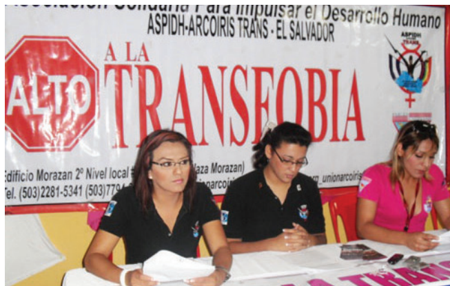
Miembros de ASPIDH promueven los derechos sanitarios trans.

La organización fue fundada en 1996, pero no pudo obtener un estatus legal hasta 2009. Ese año ASPIDH creó su propio centro comunitario llamado "Somos Saludables" con el apoyo de amfAR, la Organización Panamericana de Mercadeo Social (PASMO), el PNUD y el Fondo Mundial. El centro sirve como punto de encuentro de la comunidad y provee materiales de prevención del VIH, la prueba combinada del VIH, consejería y servicios de apoyo en coordinación con los hospitales públicos.