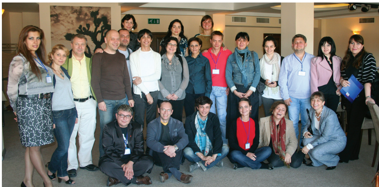
Activistas regionales LGBT desde el sur del Cáucaso en una reunión apoyada por amfAR/Tanadgoma para discutir cuestiones trans.

Tanadgoma diseñó el estudio que posteriormente fue aprobado por el Consejo Nacional de Bioética de Georgia. La encuesta se llevó a cabo por Tanadgoma, Nosotras por la Igualdad Civil