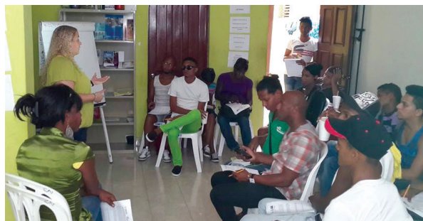
Una capacitación comunitaria de COTRAVETD