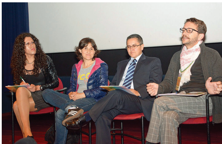
Miembros de Alfil participan en un panel.

Asociación Alfil fue fundada en 1999 como una organización de apoyo a los gais, pero ha crecido hasta incluir a las lesbianas, bisexuales y personas trans. En 2005, la organización decidió abordar el impacto de la vulnerabilidad estructural de la comunidad trans en Ecuador. Este trabajo implica varias estrategias, incluyendo la incidencia en el gobierno por cambios en las políticas, la documentación de las violaciones a los derechos humanos de las personas trans, y proporcionar capacitación para el personal de las instituciones de salud pública sobre la manera de ofrecer asesoramiento sobre el VIH, adecuadas a las necesidades de cuidado de la población trans. Actualmente, el trabajo de Alfil en temas trans se centra en la superación de los obstáculos para el acceso a la atención en