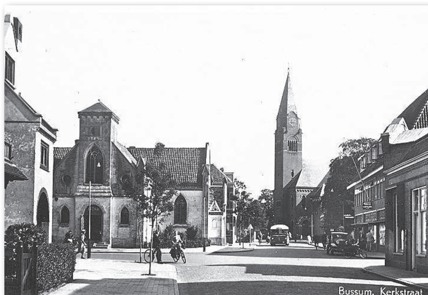
Gebouw Irene voor de verbouwing

Technici van Philips gingen op zoek naar een geschikte ruimte voor de nieuwe studio. Hilversum leek een logische keuze, want daar zaten de radiostudio's en had Philips ook een vestiging. Toen daar geen ruimte beschikbaar bleek, kwam de tip dat in Bussum een deel van een voormalige kerk leeg stond. Het gebouw was niet ideaal, maar het was direct beschikbaar, had een grote centrale ruimte en een toren voor de straalzender. Een deel werd nog bezet door textielhandel Irene. De Bussumse Courant meldde op 3 februari 1951 dat Philips de ruimte gehuurd heeft ten behoeve van een studio.