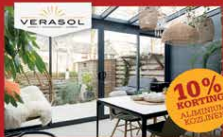
VERASOL ALUMINIUM KOZIJNEN