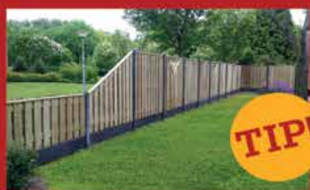
HOUT- EN BETONSCHUTTING