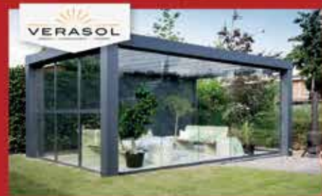
VERASOL HIGHLINE CUBE

in 't Hout Veranda's Carports Hekwerk Dé Specialist uit het Noorden Nieuw: glasdak met geïntegreerd solar!