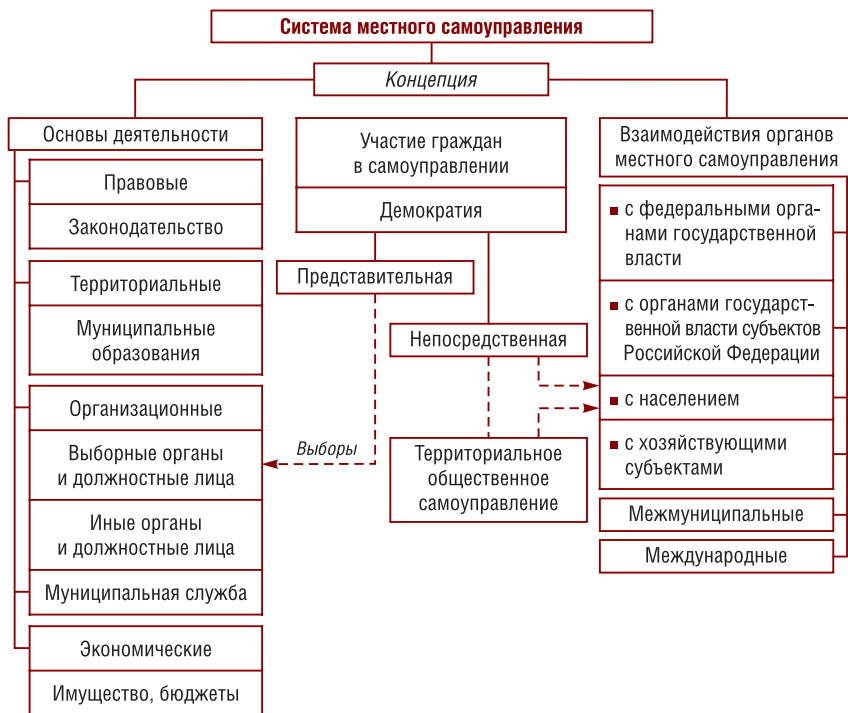
Рис. 1.2. Система местного самоуправления в России

низкий уровень его социальной активности. Наша страна многие столетия жила в условиях сменяющих друг друга тоталитарных режимов и общество не выработало глубоких демократических и самоуправленческих традиций. Имеет место низкая правовая культура населения и дефицит знаний о природе самоуправления. Поэтому идеи местного самоуправления, которые требуют от рядового человека превратиться из пассивного потребителя благ и жалобщика в самостоятельного субъекта, формирующего базовые условия своей жизни, воспринимаются далеко не всеми.