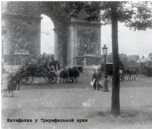
Катафалка у Триумфальной арки