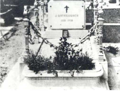
Могила Какуцы Чолокашвили на кладбище Сантоэне в Париже

Паата НАЦВЛИВИЛИ Публикуется с сокращениями