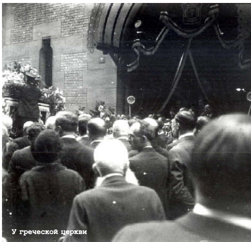
У греческой церкви

Между прочим, он попросил меня написать немало писем, поскольку рука уже ему отказала. Я хотел перевести его в лучшее место, в Давос, но