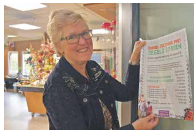
Hunebedcity doet ook mee aan De Dubbel December Pret zegelactie

De ondernemers in Borger hebben hun best gedaan om alles er in het dorp gezellig te laten uit zien. De etalages van de winkels zijn helemaal in de stijl van Sinterklaas en Kerst ingericht. Kerstbomen en feestverlichting in de straten zorgen ervoor dat het in Borger extra gezellig is deze laatste weken van het jaar. Hierdoor is het nog leuker om in Borger uw boodschappen voor de feestdagen te doen. Uiteraard alles in overeenstemming met de richtlijnen rond de maatregelen.