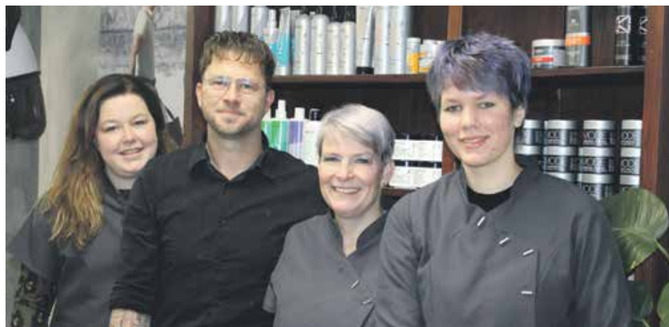
Kapsalon Unique, Valthermond

Wat tonen ze een enorme veerkracht. Al die ondernemers die na de verplichte sluiting weer hun deuren openden voor het publiek. Als vanouds staan ze er weer en zijn ze er voor de vele klanten die hun zaken weer kunnen bezoeken. Hopelijk is, als u dit leest, ook de horeca weer open voor het talrijke publiek.