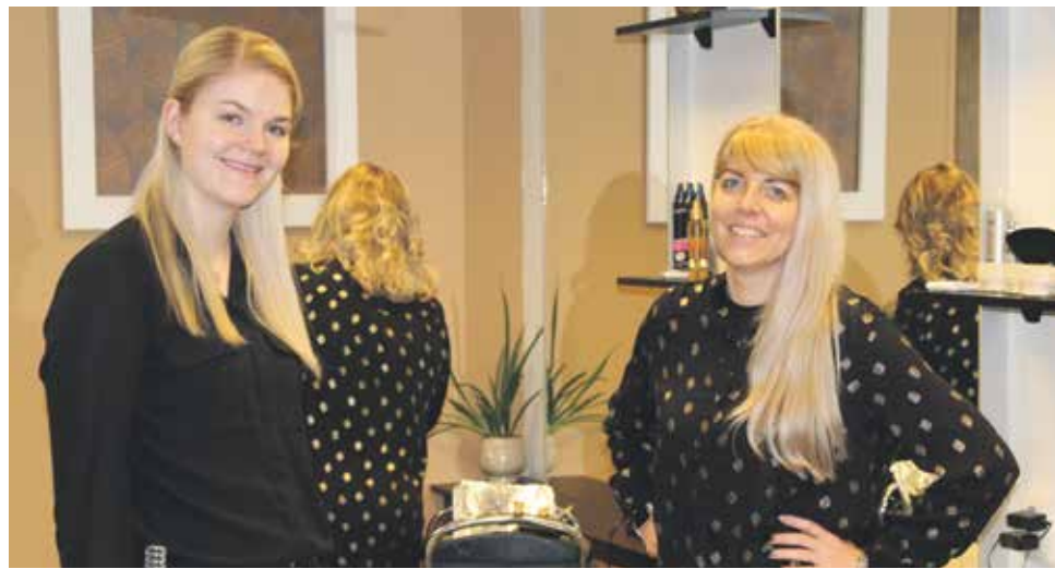
Kapsalon de Spiegel, Borger

Wat tonen ze een enorme veerkracht. Al die ondernemers die na de verplichte sluiting weer hun deuren openden voor het publiek. Als vanouds staan ze er weer en zijn ze er voor de vele klanten die hun zaken weer kunnen bezoeken. Hopelijk is, als u dit leest, ook de horeca weer open voor het talrijke publiek.