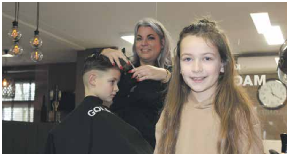
Kapsalon Magnifique, Valthe

Sinds enige tijd zijn ook de kapperszaken weer open in onze regio en daarmee is men ook weer 'Back in Business'. Inmiddels waren ze drie lockdowns verder en iedereen hoopt natuurlijk dat het nu echt de laatste is geweest. Alsof er niets is gebeurd staan ze weer dagelijks te knippen, te kammen, te fohnen etc etc. Sommige kapperszaken openden afgelopen tijd zelfs al om 07.00 uur 's morgens hun deuren.