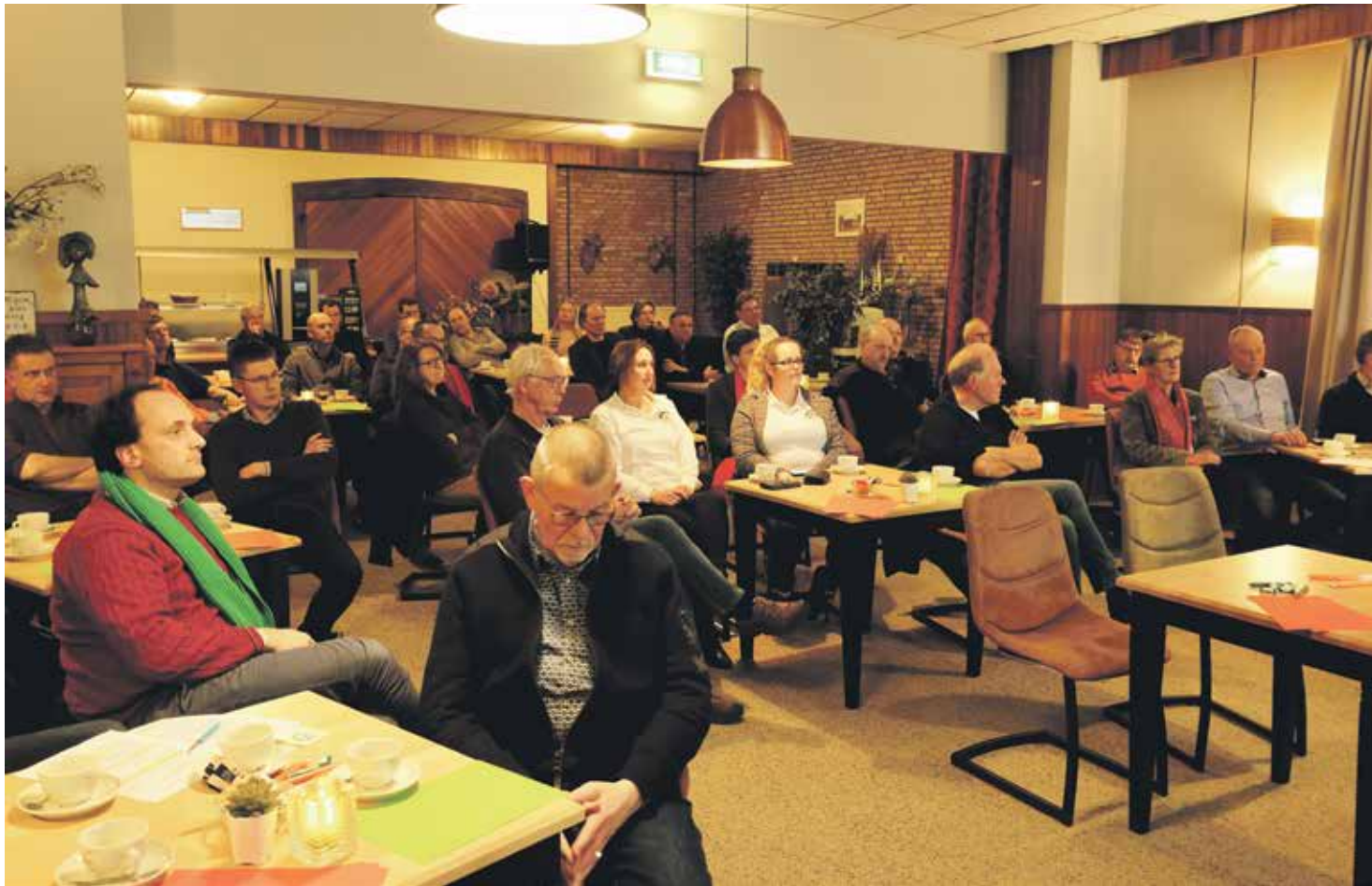
Tijdens het verkiezingsdebat waren tientallen LTO-leden en lokale politici aanwezig.