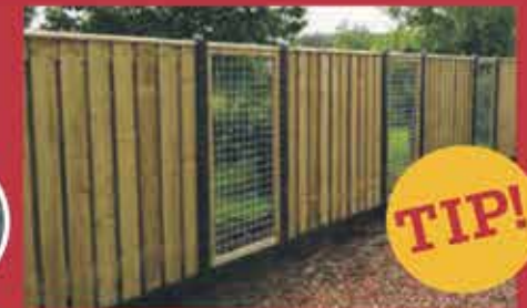
HOUT- EN BETONSCHUTTING