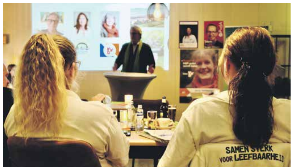
De bereidwilligheid tot samenwerking tussen lokale politiek en de agrarische sector in de gemeente lijkt groot.