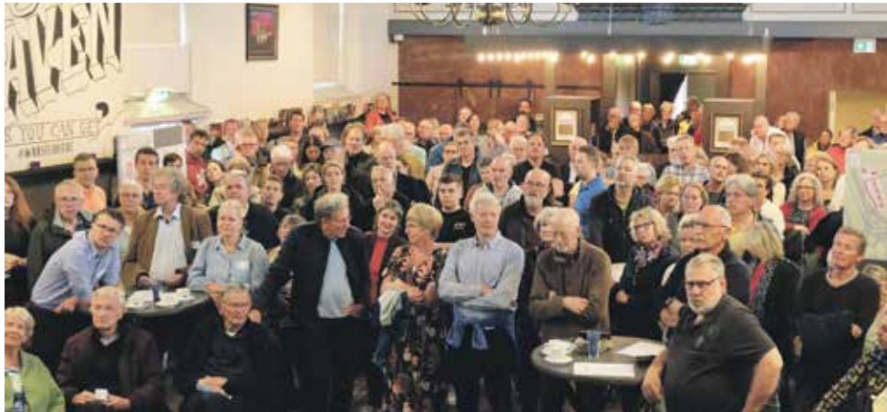
De Willibrordkerk was te klein tijdens de informatiebijeenkomst ontwikkeling woondorp Borger