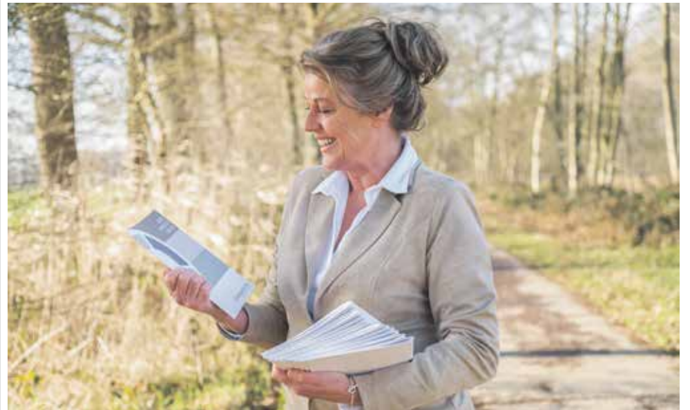
Het Goed Geregeld Boekje bestellen kan via www.nabestaandenkantoor.nl

In gesprek gaan over later. We kunnen het niet voor ons uit blijven schuiven. Het onderwerp 'dood' krijgt in de media steeds meer aandacht, het er over hebben blijkt nog steeds heel moeilijk voor veel mensen. Terwijl dit zo helpend kan zijn voor degene die een verlies geleden heeft, of voor iemand die wil praten over zijn eigen levenseinde. Het NabestaandenKantoor heeft het Goed Geregeld Boekje gemaakt met als doel om levenseinde gesprekken makkelijker te maken én om belangrijke informatie en wensen vast te leggen. In het boekje staan tips en wordt uitleg gegeven over zaken die direct na het overlijden geregeld moeten worden. Voor nabestaanden/executeur is het boekje een houvast om alle zaken af te wikkelen in de lijn van uw wensen. Het voorkomt spanningen en maakt het afhandelen van praktische zaken eenvoudiger.