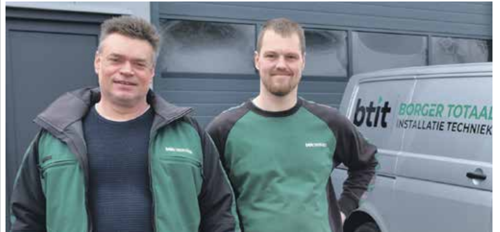
BTIT, nieuw allround installatiebedrijf in Borger met groeiambitie