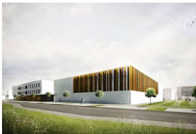
Wizualizacja od strony ulicy Andersena widok w stronę szkoły podstawowej