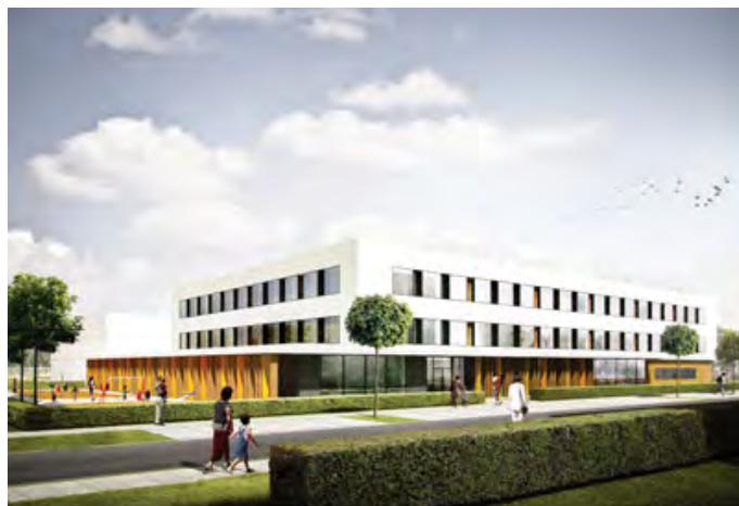
Wizualizacja od strony ulicy Dzikiej widok w stronę części przedszkolnej budynku szkoły podstawowej