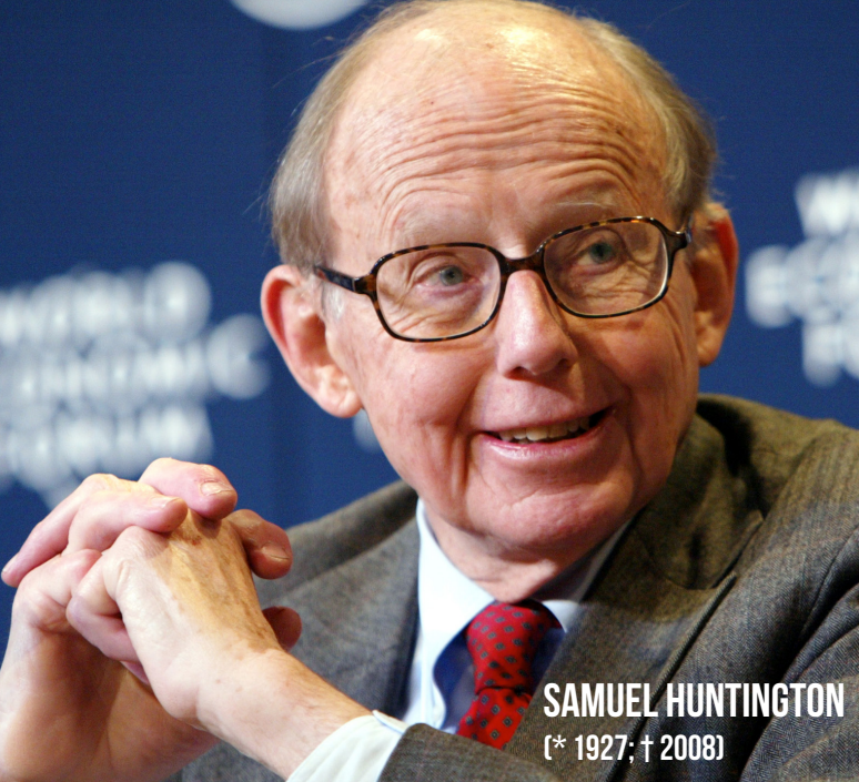
SAMUEL HUNTINGTON [* 1927; † 2008]

Det samme kan siges at gøre sig gældende for det sidste navn, der her skal fremhæves: den amerikanske politolog Samuel Huntington (1927-2008). Huntington udgav i 1993 det paradigmatisk værk The Clash of Civilizations som et direkte svar på Francis Fukuyamas The End of History . 19 Hvor Fukuyama hævdede, at historien var afsluttet med det liberale demokratis sejr, pegede Huntington på, at man tværtimod stod over for nye konfliktlinjer, der ville træde i stedet for det ideologiske skel, der havde præget Den kolde krig. Fremover