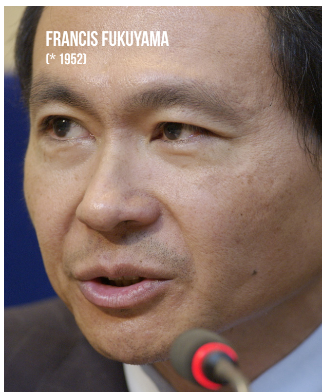
FRANCIS FUKUYAMA [* 1952]