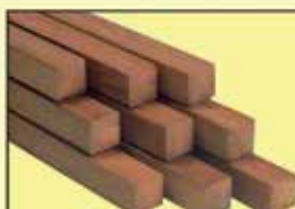
Hardhouten palen 60x60mm. Lengte: 275,300cm. TIJDELIJK € 4,00 per meter

88x88mm. Lengte: 240, 270, 300cm. TIJDELIJK € 3,50 per meter