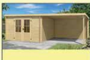
Blokhut Orlando 292 x 601