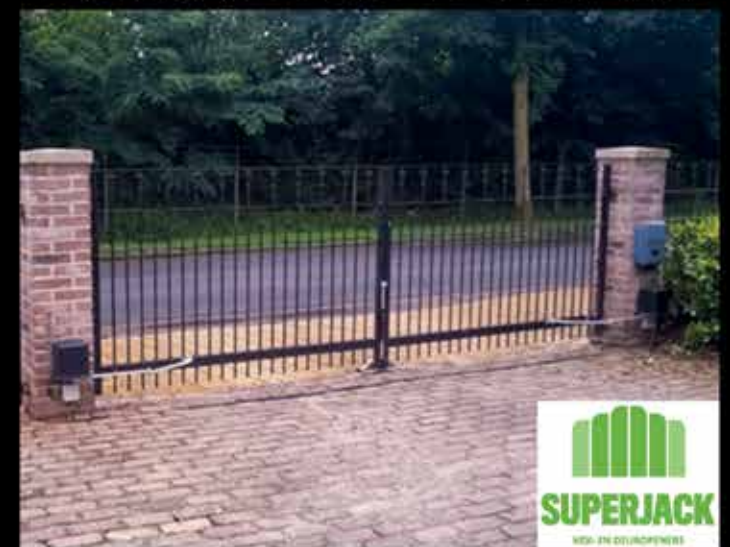
LEVERANCIER VAN HEKOPENERS