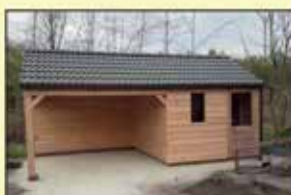
Lariks tuinhuis Afm. tuinhuis: 300 x 300 cm. Afm. Overkapping: 300 x 300cm. punt dak incl. golfplaten incl. 1 hardhouten glasdeur en 1 raam

Prijs op aanvraag andere afmetingen mogelijk