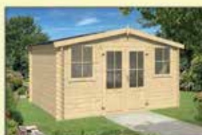
Blokhut Dallas 375 x 292 cm

Tijdens de Bouwvakvakantie zijn wij geopend van 09.00 t/m 13.00 uur.