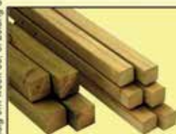
Geïmpregneerde palen 68x68mm. Lengte: 180,210,240,270,300,360cm TIJDELIJK € 2,25 per meter

e-mail: info@scholtehoutindustrie.nl of bel naar 0599-470500