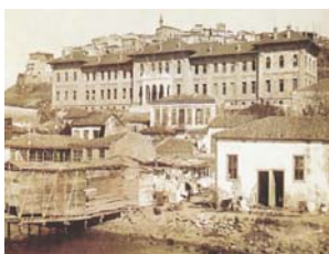
Εικ. 1 Το κτίριο του Πανεπιστημίου Σμύρνης με το πρόπυλο/ προσθήκη του Αρ. Ζάχου

Για τη στέγαση της βιβλιοθήκης, των τεσσάρων σχολών, εργαστηρίων και λοιπών λειτουργιών του Πανεπιστημίου διασκευάστηκε και επεκτάθηκε ένα προϋπάρχον οθωμανικό ημιτελές κτιριακό συγκρότημα στο λόφο Μπαχρή Μπαμπά. 4 Το συγκρότημα περιελάμβανε 70 ευρύχωρες αίθουσες, αμφιθέατρο 320 θέσεων, μεγάλη Βιβλιοθήκη και οικήματα για τον πρότυπη και τους καθηγητές. Ήταν κεραμοσκεπές με εκτεταμένα γείσα, κατασκευασμένο από οπλισμένο σκυρόδεμα με εμφανή τοιχοποιία από