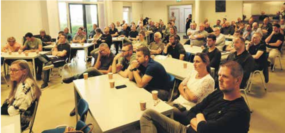
Zo'n tachtig boeren en boerinnen waren aanwezig bij de infobijeenkomst over het nieuwe GLB in Valthermond

VALTHERMOND - Om in aanmerking te blijven komen voor de subsidies die boerenbedrijven levensvatbaar houden, moeten deze bedrijven volgend jaar voldoen aan de eisen van de nieuwe invulling van het Europese Gemeenschappelijk landbouwbeleid (GLB). Zo'n tachtig boeren en boerinnen uit de Veenkoloniën en omgeving kwamen dinsdagavond in het Innovatiecentrum Veenkoloniën in Valthermond bijeen tijdens een infobijeenkomst van de provincie Drenthe over dit onderwerp. Daar werd duidelijk dat de boeren heel wat te doen staat om aan de regels te voldoen. Maar wat precies, is in veel opzichten zo troebel als melkglas. Eén ding is wél zeker: op 1 januari zijn de regels van kracht.