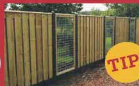
HOUT- EN BETONSCHUTTING