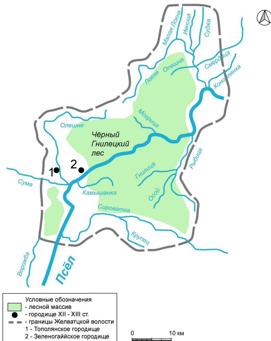
Рис. 1. Графическая реконструкция границ Желватцкой волости на основе текста оброчной писцовой книги 1628 – 1629 гг.

Это позволило выделить из массы археологических объектов те, которые существовали в XII-XIV вв. На Среднем Псле это Зеленогайское городище, городище Тополи и селище Мамаевщина. Древнерусское городище в с. Ворожба автором отождествляется с населённым пунктом Городище, а, следовательно, исключается из перечня городищ, используемых для локализации летописного города Жолваж [17, с. 16-17].