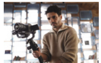
最新のレンズ設計技術で高い動画性能を実現 ※写真のボディは別売のFX3です