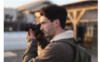
携行しやすく撮影時の取り回しのよい 小型・軽量デザイン ※写真のボディは別売のα7C IIです