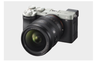
※写真のボディは別売のα7C IIです

* 画素子がAPS-Cサイズのレンズ交換式デジタルカメラ装着時の35mm判換算値