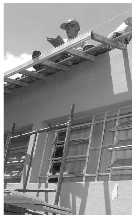
Funcionários substituem telhado e realizam outros serviços como pintura e troca de pisos e azulejos

A rede municipal de ensino possui 12 mil alunos. O calendário para o ano letivo está assim: 3 de fevereiro - retorno dos educadores; 4 - volta às aulas nas creches; 4 e 5 - curso de formação dos educadores e 11 - retorno dos alunos do ensino fundamental, infantil e parcial.