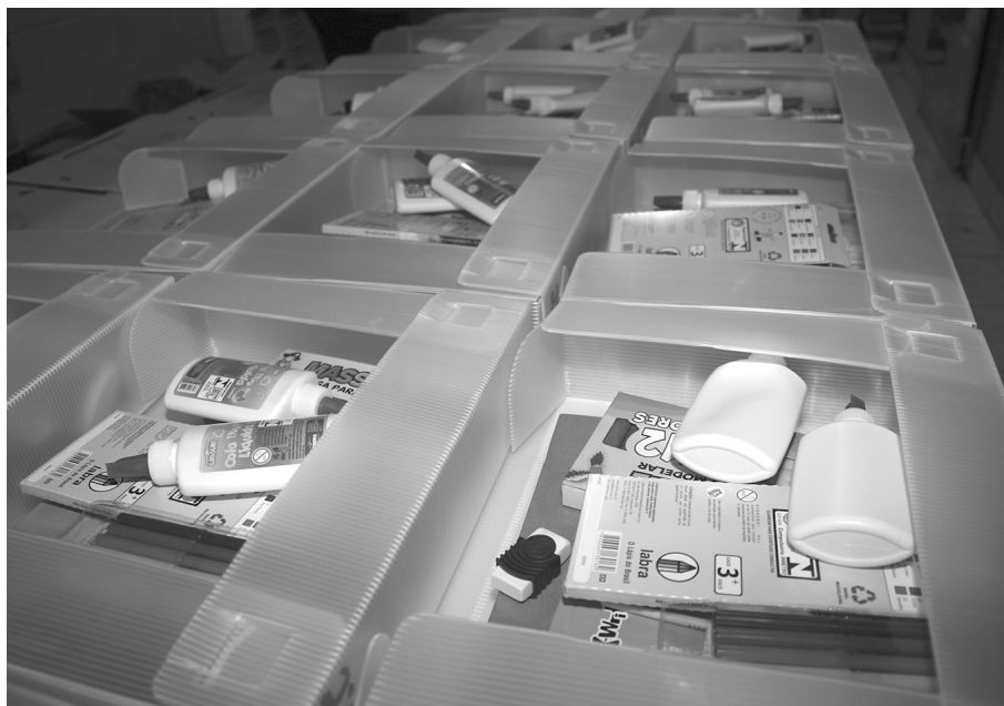
Montagem dos kits segue a todo vapor: entrega começa na próxima quinta-feira