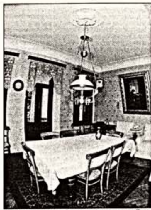
Слева: В. Светков. "Портрет А.П. Чехова". Справа: гостиная в доме-музее писателя в Ялте. Внизу: музей-заповедник "Мелитово"