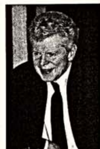
Вану Клайберну — 70

Впервые я услышал имя Вана Клайберна (в России его чаще называют Ваном Клайберном) в 1958 году на Международном конкурсе имени П.И. Чайковского.