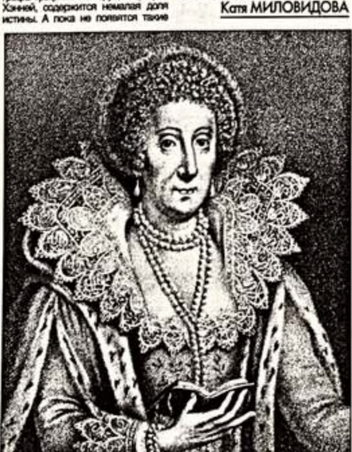
Мари Сидни Герберт, графиня Пембрук

эрудацией и знанием многих иностранных языков. Имен больше связи с театральным миром, она могла легко переплести пьесы театральным кругам. Возможно, это простое соображение, но перепись пьес Шекспира была опубликована анонимно, и три из них имели на титульных листах любовно-личное примечание о том, что они были поставлены авторской труппой Pembroke's Men, которую поддерживали муж и жена Пембрук.