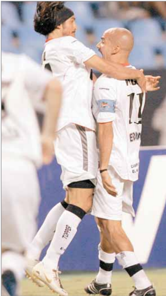
Obrigado, pero... Verón le dijo que no a la oferta del Santos

El central albirrojo, que se quedó trabajando en La Plata, podrá estar en la próxima presentación del Pincha en el certamen internacional.