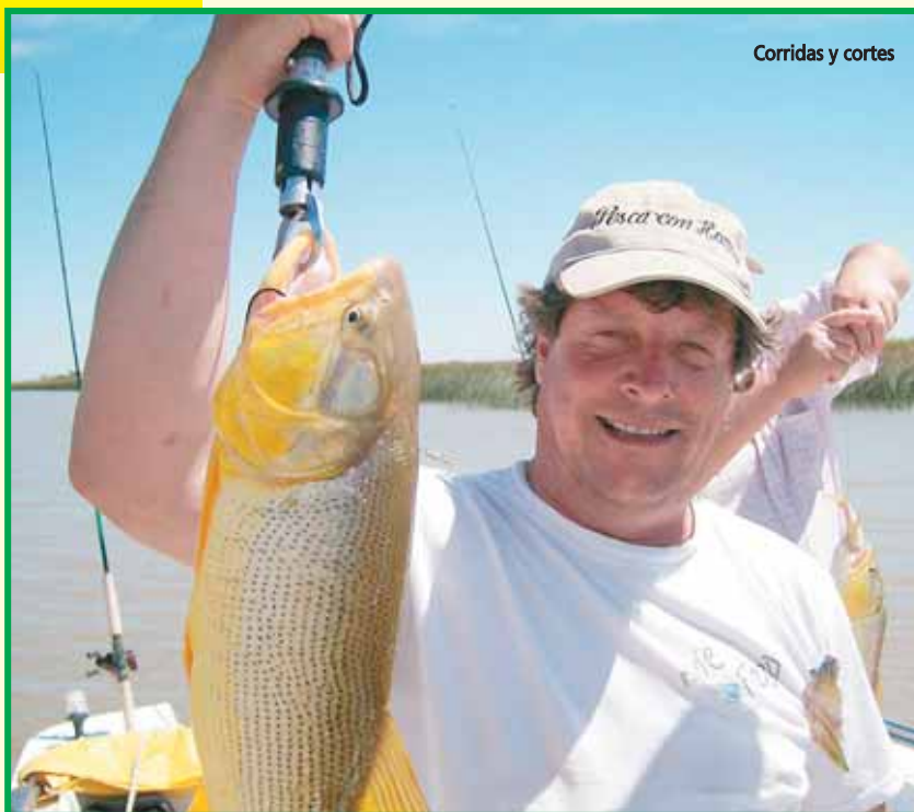
Corridas y cortes