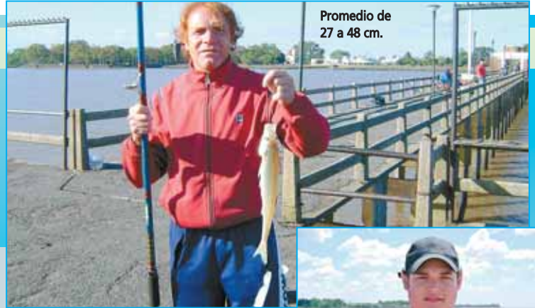
Promedio de 27 a 48 cm.

Entre las 13 y las 16 la pesca fue en ascenso, los portes en el morro del espigón