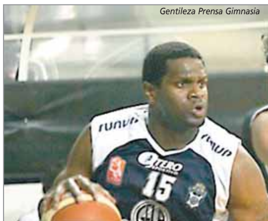
Lo hizo ante los juninenses. La noche del martes tuvo fiesta en el Poli

En la 5ª fecha del TNA cayó el fruto pero tuvo que esperar mucho, incluso hasta el tiempo suplementario. Gimnasia superó a Ciclista de Junín y mañana irá -también en su casa del Poli- ante Belgrano de San Nicolás. El final fue 80-77.