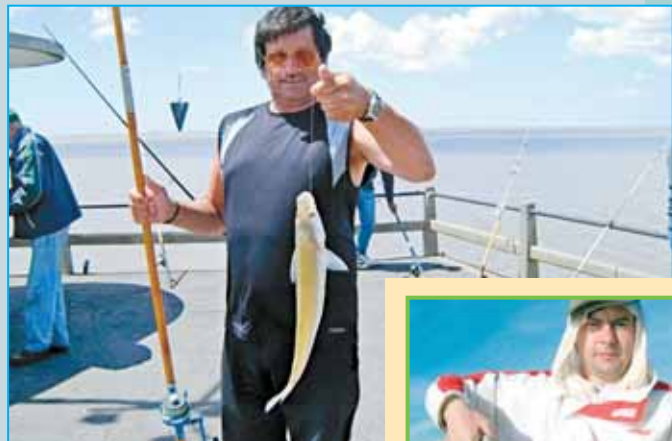
Con la bajante comenzó la pesca