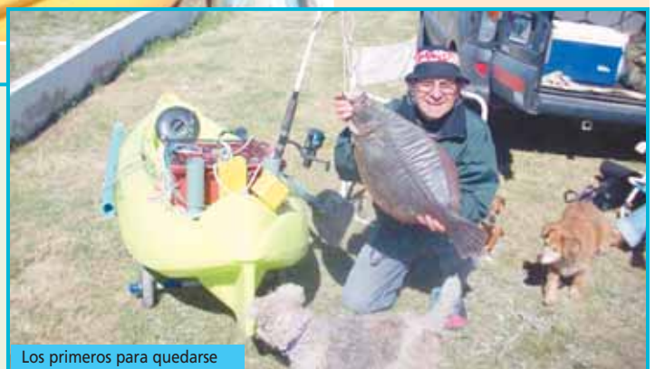
Los primeros para quedarse

marca Atlantikayak's. ■ 1 GPS navegador satelital marca Garmin. ■ Chalecos salvavidas Atlantikayak's. ■ Conservadoras de camping marca Helatodo. Y muchos sorteos más... La inscripción es con reserva telefónica directa con Sebastián Márquez, de MDQ-Team. Teléfonos: (0223) 155-45 9138. Fecha de inscripción: desde el 18 de octubre al 15 de noviembre del 2008. Costo: $ 40 por persona, con almuerzo y cena incluidos.