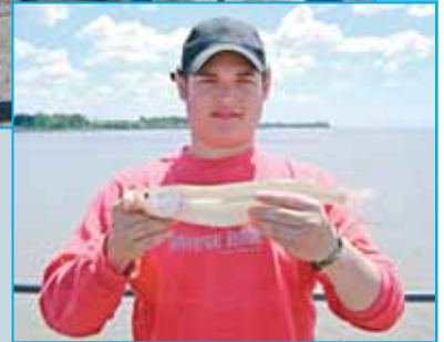
Rindió el filete de peje o dientudo

Los que ejercitaron la pesca del morro hacia la caseta y de esta hacia la costa fracasaron, a flote tanto con barranquín como con boya yoyo fue nula, el peje no comió arriba.