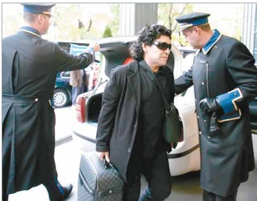
Bienvenida al Hotel Internacional de Madrid. Así llegaba el nuevo DT de la Selección mayor de AFA