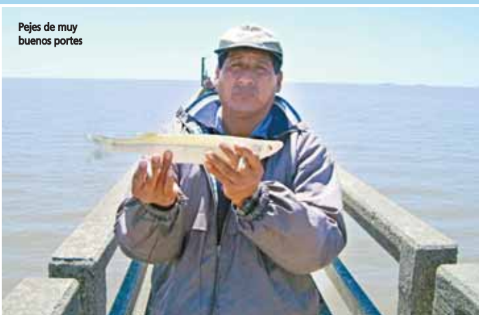
Pejes de muy buenos portes