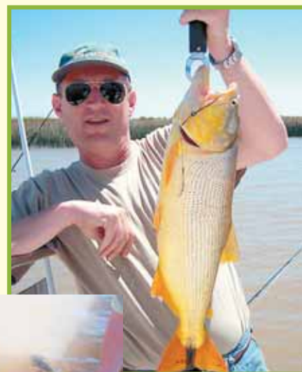
Fotos y al agua