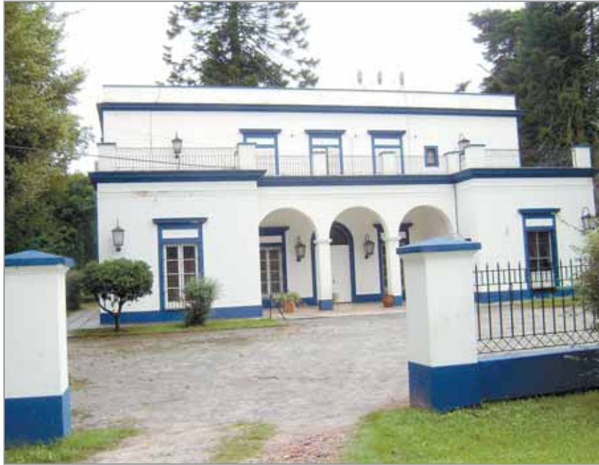
La Casona. Uno de los lugares históricos que tiene el predio de Abasto. Allí se aloja el plantel

Es por ello que la dirigencia actual tras el estudio realizado, decidió dar este primer paso que tiene que ver con reordenar el lugar, ponerse en contacto con aquellos dueños para buscar que por fin el predio de Estancia Chica tenga en poco tiempo un barrio con las disposiciones previstas una vez que se loteó (una de ellas es que el terreno no tenga más del 30% de construcción, como así también que cada lote no esté a más de 200 metros del asfalto). Pero previo a esto, el club busca por estas horas juntarse con los propietarios para darle un marco a la idea. Por estos días, alrededor de 120 personas han presentado en el club algún tipo de documentación que los acredita como dueño, y estos ya se han puesto en contacto con el escribano en cuestión para empezar los trámites de escriturar. Pero hay muchos