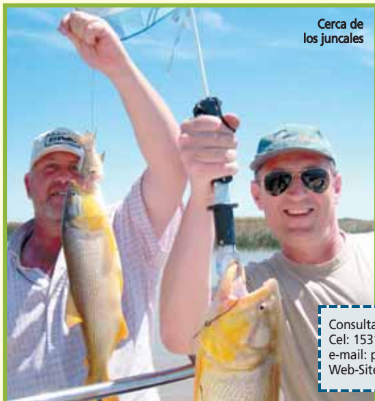
Cerca de los juncales