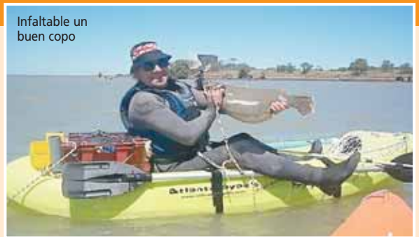
Infaltable un buen copo

L a pasión del kayakfishing definitivamente se trasladó estos días a Mar Chiquita, faltando pocos días para el 2do Encuentro Nacional de Kayakfishing muchos adeptos se encuentran practicando en las aguas de la albufera, también en el mar donde el pique repuntó en estos últimos días.