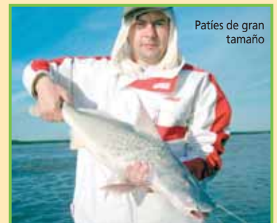
Paties de gran tamaño