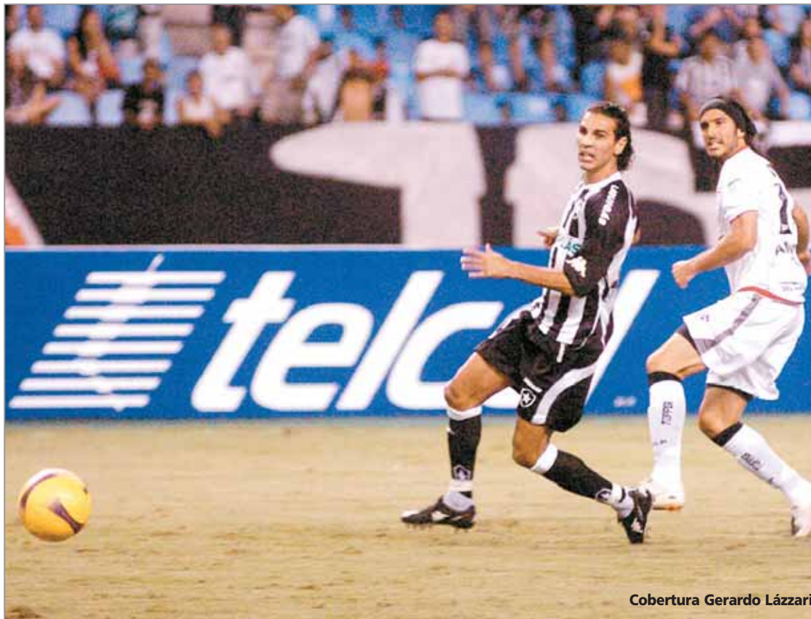
Cobertura Gerardo Lázari

Estudiantes empató 2 a 2 con Botafogo (4 a 2 en el global) y se clasificó a las semifinales de la Copa Sudamericana. Angeleri y Salgueiro marcaron para el equipo de Leonardo Astrada, y Lucio Flavio y André Luis empataron para los brasileños. Ahora se viene el Bicho