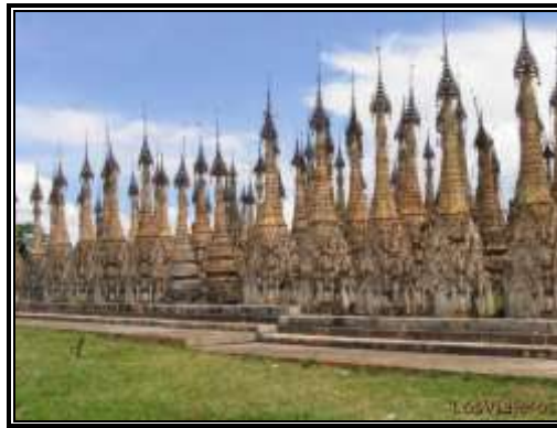
Estupas de Kakku - Estado Shan

Kakku esta situado en el territorio de la tribu Pa-Oh en el estado Shan. El area que cubre es de casi 1 km2 y tiene unas 200 estupas. La más alta mide unos 40 metros.