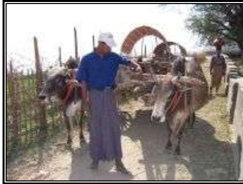
Típico campesino birmano vestido con el longyi.

La situación económica de Birmania es bastante delicada. La agricultura es la principal actividad económica; ocupa a casi los 2/3 de la población activa y contribuye en un 40% al producto interior bruto. El cultivo predominante es el arroz, que ocupa cerca de la mitad de las tierras cultivables. Los demás cultivos (algodón, cacahuete, hevea, té) son secundarios. Es de destacar igualmente el cultivo de la adormidera.