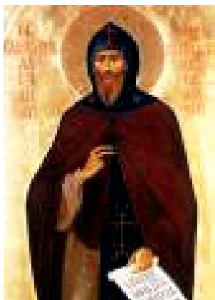
Свети Александар Невски

земља била остала без чифчија 25 . Према томе, Васојевићи из Лијеве Ријеке су населили долину Лима у првој половини 18. вијека, те се од тада и