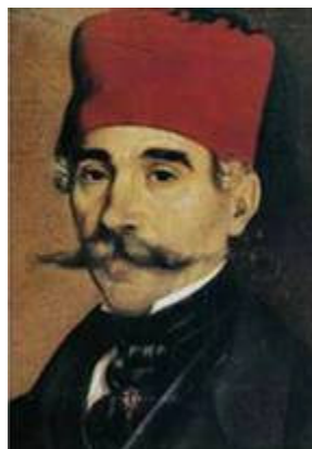
Вожда Карађорђа Петровића и Вука Стефановића Карацића изнедрили су Васојевићи