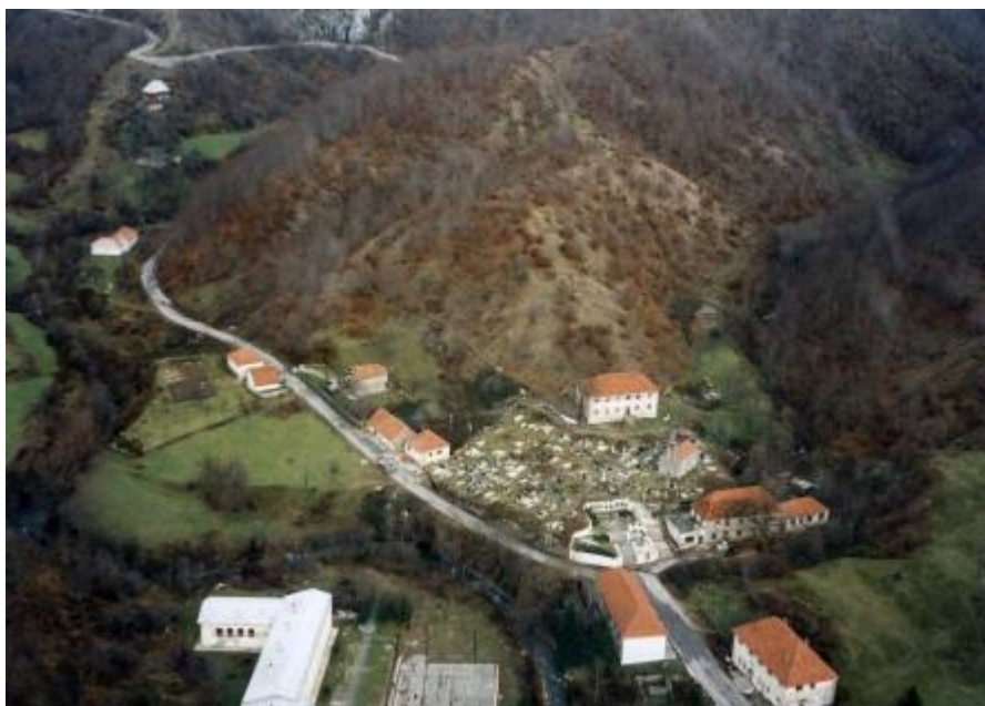
Панорама Лијеве Ријеке (2006)

ријеку, а црква с лијеве, гдје је једно старо гробље на Ножици, а обоје с десне стране ријеке. Том мјесту Васојевићи одају поштовање у причама. Но чудим се што ова мјеста нијесу заграђена ...». Овим ријечима прота Милош Велимировић у књизи На Комовима , описује мјесто гдје је била Васова кућа и Васова црква. Васова црква на Ножици је утемељена крајем 14. вијека, а обновљена је и освештана 2002. године 15 и зове се Црква светог архангела Михаила. У овој цркви се налази саркофаг са Васовим моштима, а на саркофагу пише Војвода Васо Васојевић . Васови потомци су биолошки били веома здрав и прогресиван род који се веома брзо множио, те је, поред Ножица, на ширем подручју Лијеве Ријеке убрзо формирао села: Лопате, (Лијеву) Ријеку, Ками, Душке, Љевају, Птич, Грби До и Тузи, а касније и насеља Слацко, Ступови, и Ханови 16 .