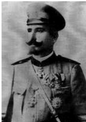
Бригадни ђенерал и министар војни Радомир Вешовић