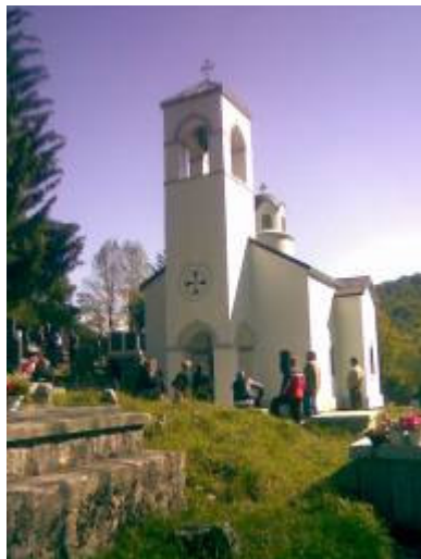
Васова црква на Ножици - - Свети архангел Михаило

Пипери, као и Хоти у Малесији, помињу се у писаним материјалима 1485. године 19 . Како је племе Васојевића настало на Ножици на простору тада већ постојећег и знатно старијег племена Куча, оно је у најбољем случају могло бити оформљено у другој половини или крајем 15. вијека.