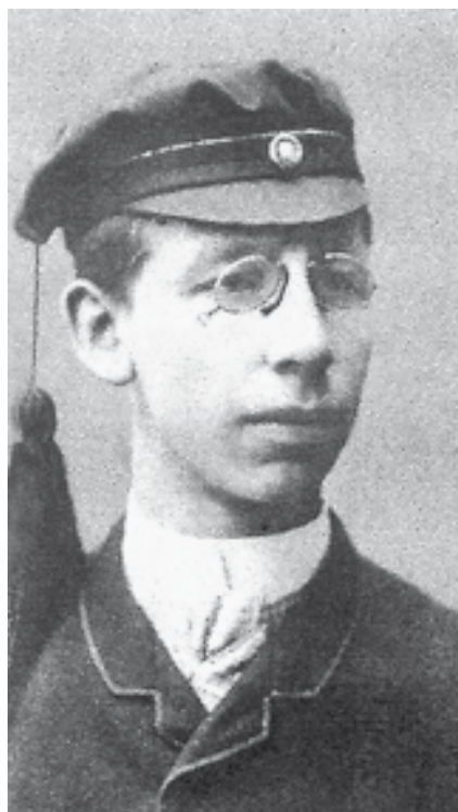
Johan Vaaler, etter portrett i Studenterne fra 1887.

Published in The Book-Keeper , Aug. 1894, p. 6. Discovered by The Early Office Museum ( www.officemuseum.com )