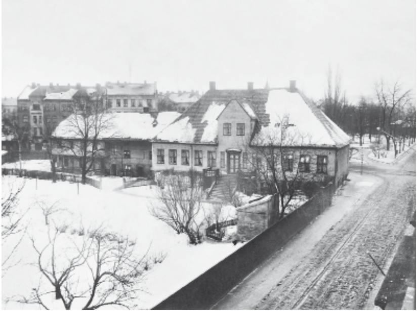
CA 1910