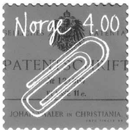
Postens minnefrimerke fra 1999 med den velkjente binders av typen «Gem» med Vaalers tyske «Patentschrift» som bakgrunn. Design: Enzo Finger.

kontorskuffen og bruker til allverdens gjøremål, blant annet til å hefte sammen papir, er dessverre ikke oppfunnet i Norge. Bindersen i skuffen har en annen form enn den «papirklemmen» som Johan Vaaler fikk patent på. I sin grunnform er bindersen som vi kjenner den i dag aldri blitt patentert. Men den antas å ha vært i produksjon i England kanskje så tidlig som i 1880-årene. 2 Der ble den fremstilt av firmaet «Gem Ltd.» og solgt under varemerket «Gem» – «edelstenen». Det forklarer hvorfor svenskene, som stort sett er merkelig uvitende om bindersens norskhet, insisterer på å kalle den «ett gem» – uten å ane hvor de har fått den betegnelsen fra. 3