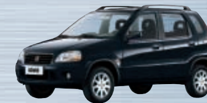
Bluish Black Pearl Metallic (ZJ3)