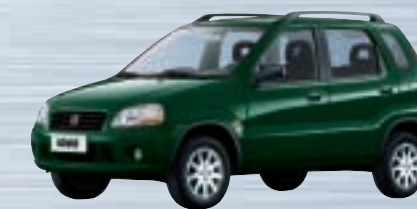
Grove Green Pearl Metallic (Z2T)