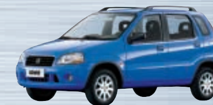
Cyprus Blue Metallic (Z2J)