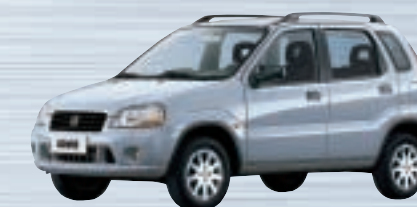
Silky Silver Metallic (Z2S)