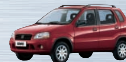
Cassis Red Pearl Metallic (Z5K)