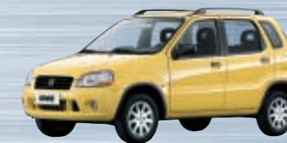
Naples Yellow (Z1E)

• = Serienausstattung ○ = Sonderausstattung (gegen Aufpreis)