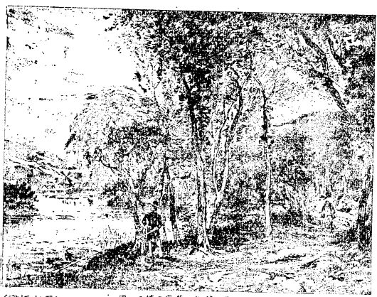
(證植本原) 園、巧、家、水、時、再、士、部

難キヲ傷ム、歐雲、利水、萬里、處ヲ異ニシ、各天、參 商ノ如ク、萍蹤、定處、ナク、離夢、躑躅、別魂、飛揚、シ 風流、雨散、一別、雲ノ如ク、蘭摧、ケ風、去リ、祇ニ、姿 カ情ヲ、摠ス、命運、天ノミ、亦何ソ、怨、ミン、大丈 夫、四海ニ、志ス、萬トシテ、比隣ノ、如シ、思、宛、荷、モ 虧ケ、スンハ、遠キニ、在レトモ、猶ホ、親、愛、セン、何 ソ、必ス、シモ、衾、幃ヲ、同シテ、而シテ、後、殷、勤ヲ、展 ヘンヤ、郎君、遠、猷、翼ヲ、振ヒ、名ヲ、汗、青ニ、垂、レ、ヨ 良時、茲ニ、在リ、失フ、勿レ、異日、東洋ノ、男子、天ノ 一國ニ、賦與、スル、正義ニ、仗リ、自由ノ、旗ヲ、揮ヒ