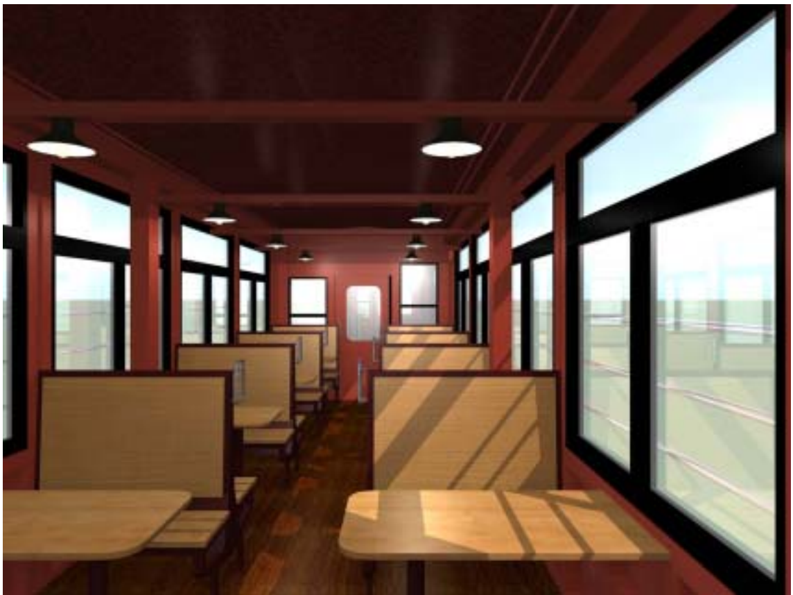
インテリアイメージ