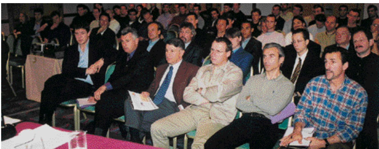
De nombreux délégués clubs avaient répondu présents.

Il est rappelé que les contrats « espoir » en cours iront à leur terme aux conditions financières prévues à la Charte et ne sont pas remis en cause. Cette modification ne s'applique qu'aux nouveaux contrats.