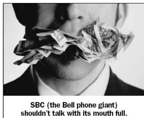
SBC (the Bell phone giant) shouldn't talk with its mouth full.