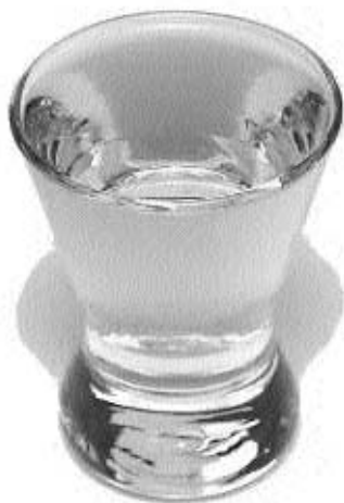
Teq paf' :