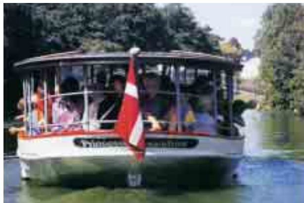
»Prinsesse Alexandrine«, som Dronning Margrethes farmor lagde navn til, med den tidligere Hvide Bro og Marienborg i baggrunden.

Næste epoke i »Bådfartens historie« var dampbåden