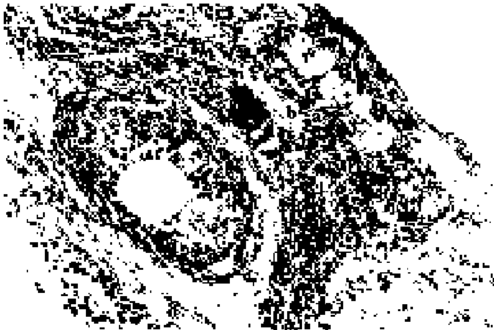
Fig. 2. Corte histológico de ovario de C. Mendocinus con folículos primordiales (a) y primarios en desarrollo (b). 400x.