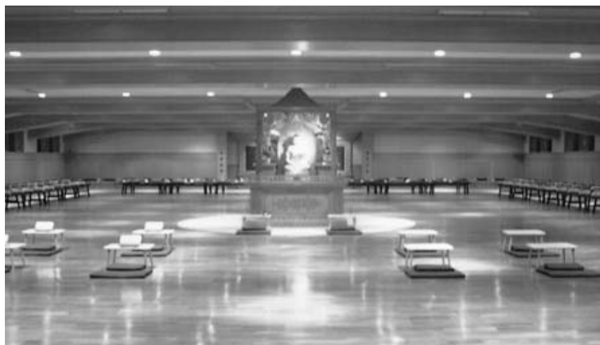
禪坐修持區——大禪堂