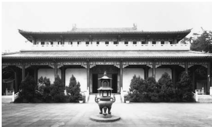
女眾學部早晚課修持區——大悲殿

以弘揚佛法之道，培養優秀人才、廣佈佛法於世間為本。星雲法師開創佛光山的四大宗旨之一，即是「以教育培養人才」，因此乃於1965年在高雄興建壽山寺時，同時創立了「壽山佛學院」，一方面廣施佛法於民眾，另一方面也藉由教育人才來傳承佛教文化。之後，由於社會各界對於佛教教育的重視，及學佛青年日益增加，星雲法師遂逐步擴大佛光山佛教教育的規模及範圍。1968年，原來的壽山佛學院移至佛光山擴大招生，並更名為「東方佛教學院」；1973年