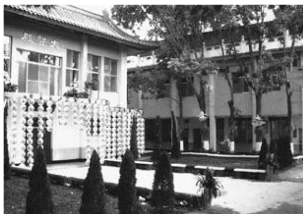
男眾學部早晚課修持區——大智殿

本院於1990年4月18日以（七九）佛叢院惠字第001號函，向主管官署內政部備案。