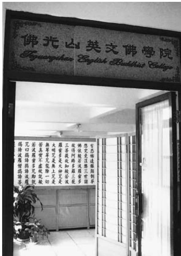
佛光山國際學部英文佛學院

擔任叢林學院教職十多年，曾教授過佛教史料學、論文寫作指導、經論解題、佈教學、禪宗學、佛法概論等課程，曾發表過多篇學術論文，是一位深受同學們愛戴的資深老師。現並擔任佛光山文教基金會副執行長一職，協助舉辦多場國際化、多元化的佛教相關學術交流活動。