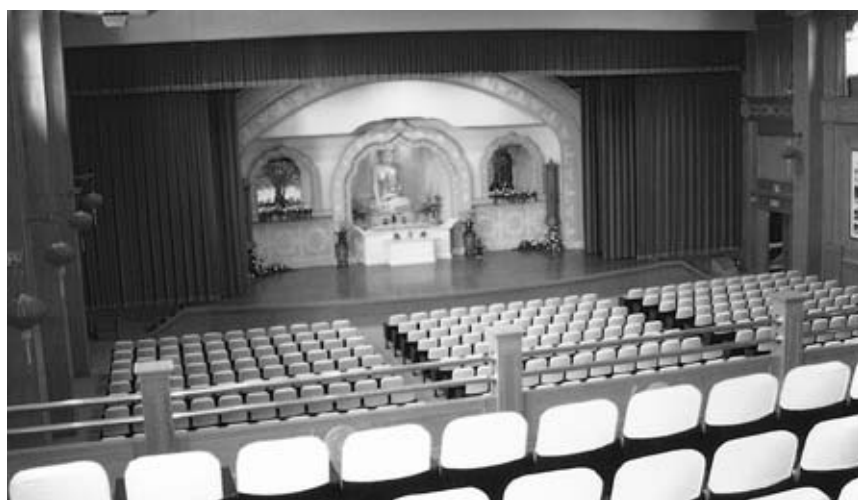
供全院上課、集會、講演的大會堂