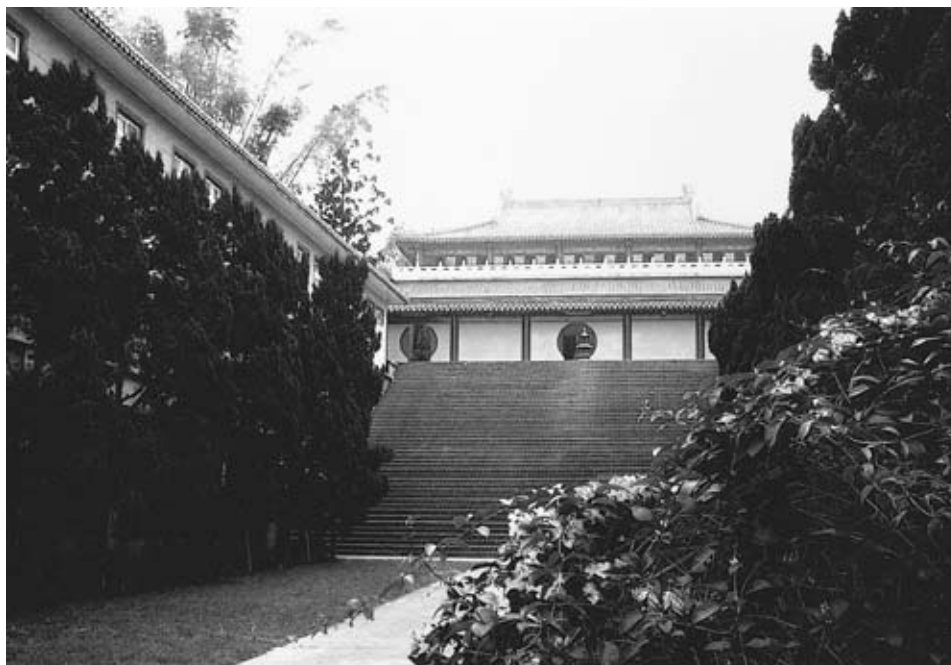
院舍一景 (學院的教學區可經由四十坡，往上與修持區連結)