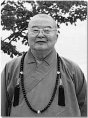
佛光山叢林學院創辦人 星雲法師