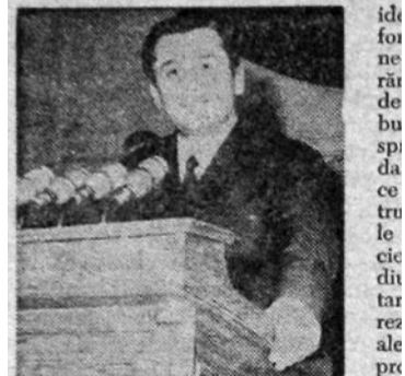
Transmițînd conferinței, tuturor delegaților și invitaților, întregii studențimi, urări de salut din partea Comitetului Central al Uniunii Tineretului Comunist, din partea întregului tineret al patriei noastre, primul secretar al C.C. al U.T.C. a spus:

estetice de cele ideologice și politice, nu poate să împingă decît pe căi sterile creația de artă.