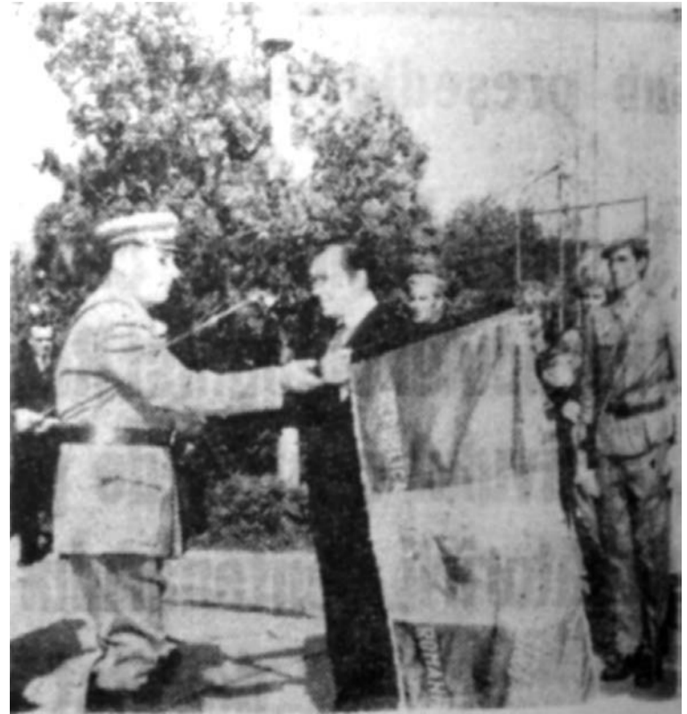
În 1977, prim-secretarul județului Iași, comunistul Ion Iliescu, înmânează gărzilor patriotice un drapel pe care, peste ani, îl va confisca cu tot cu gaură.

Duminică, în Piața Ștefan cel Mare din Iași, a avut loc festivitatea înmînării drapelului de luptă gărzilor din județul și municipiul Iași.