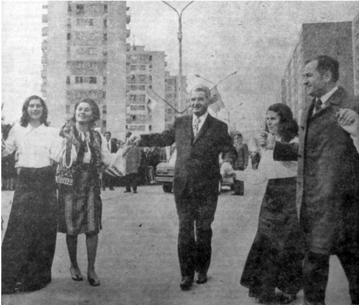
Entuziasm și bucurie în orașul Pașcani. Cu nețărmurită mândrie în sufletul său materialist-științific, Ion Iliescu încinge pe străzile unui oraș mic și nevinovat o horă cu întâiul jucător al Republicii Socialiste România, dansatorul suprem al țării.