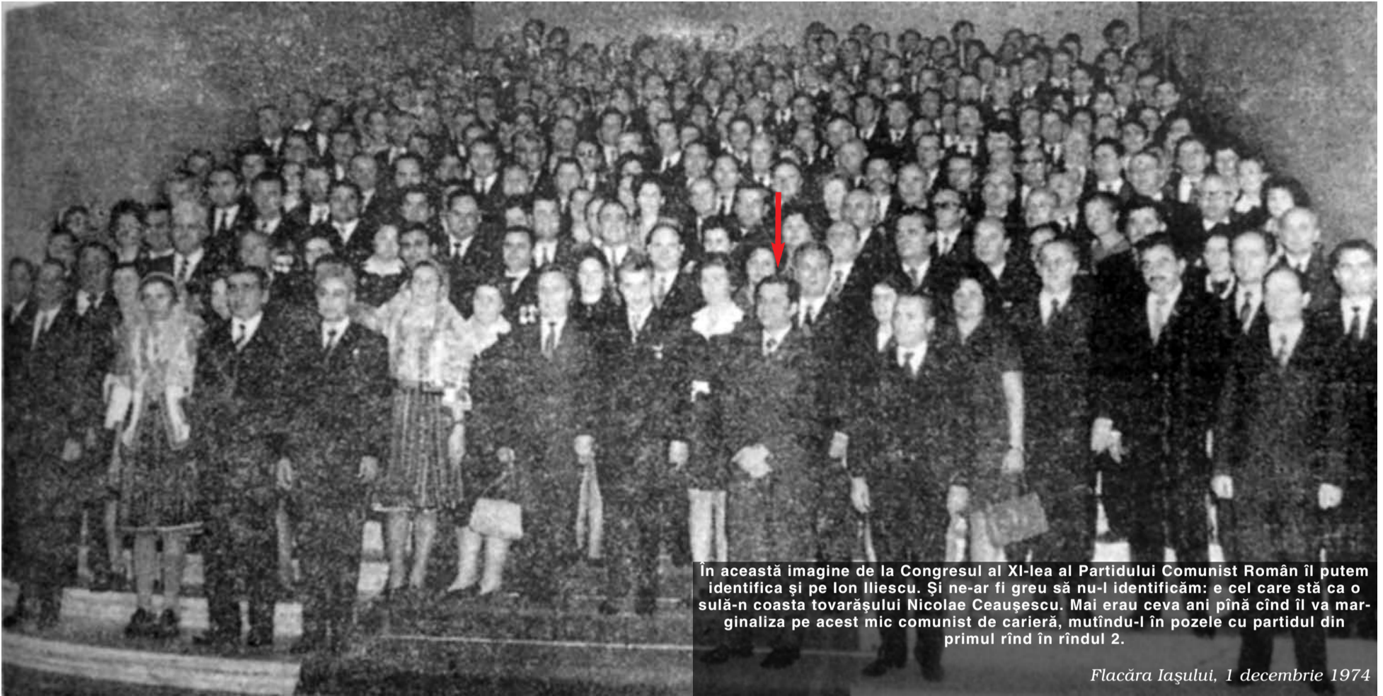
În această imagine de la Congresul al XI-lea al Partidului Comunist Român îl putem identifica și pe Ion Iliescu. Și ne-ar fi greu să nu-l identificăm: e cel care stă ca o sulă-n coasta tovarășului Nicolae Ceaușescu. Mai erau ceva ani pînă cînd îl va marginaliza pe acest mic comunist de carieră, mutîndu-l în pozele cu partidul din primul rînd în rîndul 2.