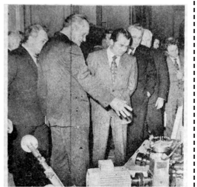
Ion Iliescu într-o vizită de lucru, jucîndu-se de-a tovarășul Nicolae Ceaușescu, în capul unei delegații a inspecției de partid, așteptînd timpurile cînd, din primul om pe județ, va ajunge, cu voia dumneavoastră, ultimul pe listă, pe țară.

Vizită de lucru în județul Iași. Tovarășul Nicolae Ceaușescu dă indicații prețioase pentru ridicarea blocurilor muncitorești în zona centrală a Iașului. Tovarășul prim-secretar Ion Iliescu de bucură de victoria socialismului și de faptul că vor mai apărea câteva zeci de cutii de chibrit în care să poată el să oprească căldura și curentul.