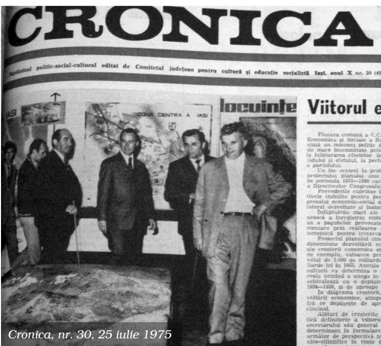
Cronica, nr. 30, 25 iulie 1975

Vizită de lucru în județul Iași. Tovarășul Nicolae Ceaușescu dă indicații prețioase pentru ridicarea blocurilor muncitorești în zona centrală a Iașului. Tovarășul prim-secretar Ion Iliescu de bucură de victoria socialismului și de faptul că vor mai apărea câteva zeci de cutii de chibrit în care să poată el să oprească căldura și curentul.