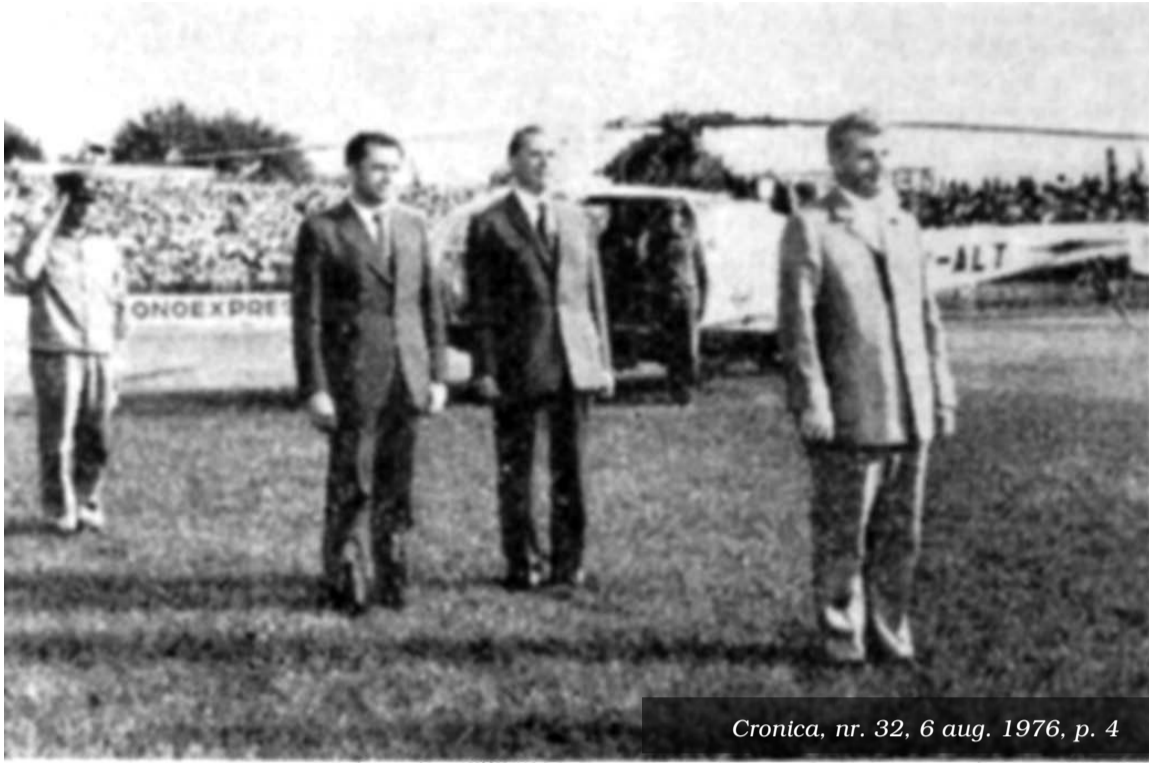
Cronica, nr. 32, 6 aug. 1976, p. 4