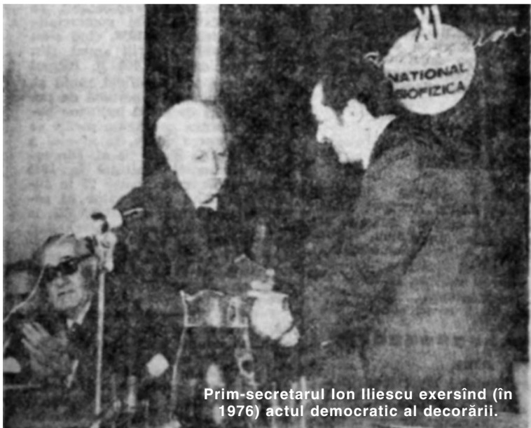
Prim-secretarul Ion Iliescu exersînd (în 1976) actul democratic al decorării.

Iașul găzduiește, de ieri, un eveniment științific deosebit: cel de-al XI-lea simpozion național de biofizică, cu tema „Acțiunea radiațiilor la nivel celular și molecular”, manifestare organizată de secția de