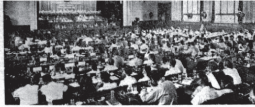
Intervenția tov. Ion Iliescu, șeful delegației noastre

(...) Nici o altă problemă – materială, cultural-sportivă sau profesională – nu va fi în mod real soluționată dacă asupra universității va continua să existe spectrul războiului, dacă studențimea din țările angajate în cursa înarmărilor este lipsită de cele necesare studiului pentru că alocațiile militare epuizează bugetele guvernelor