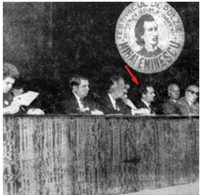
Ion Iliescu, în prezidiul Festivalului de poezie „Mihai Eminescu”, gîndind la vorbele poetului: „Și dacă ramuri bat în geam,/ Și îi votăm pe to'arși,/ Eu nici o grijă nu mai am/ Îi pup în cur la Iași.”

Contradicția dintre noul sistem politic, pe de o parte, și relațiile de producție capitalist dominante, pe de altă parte, se impunea a fi rezolvată pe cale revoluționară. (...) De aceea, la 11 iunie 1948, ca o necesitate obiectivă, a fost decretată trecerea fabricilor și uzinelor, a bogățiilor sub-solului, a întreprinderilor bancare și de transport, din mîinile burgheziei și ale capitaliștilor străini în posesia proprietarului lor legitim – poporul român, oamenii muncii, făuritorii tuturor bunurilor materiale.