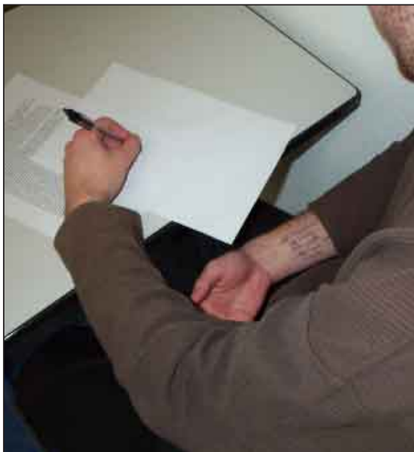
Conventionele spiekmethode bedreigd door mobiele telefoon.