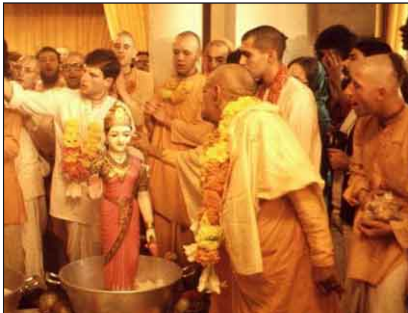
Hare Krishna aanhangers tijdens een bijeenkomst