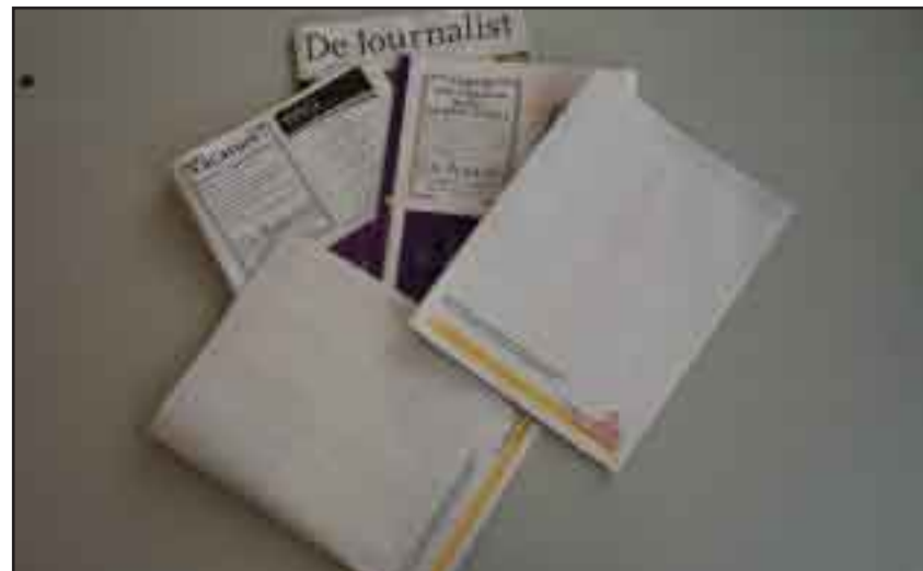
De Redactie en Redactie & Co op zoek naar nieuwe redacteuren in De Journalist