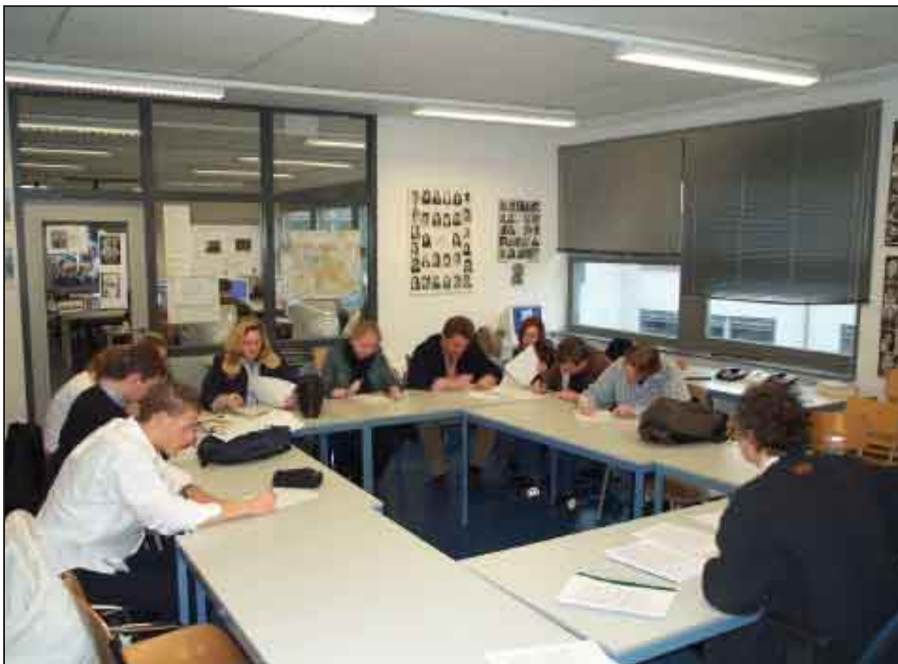
Tweedejaars studenten aan het werk tijdens hun voorbereiding op het krantenleven: deadline