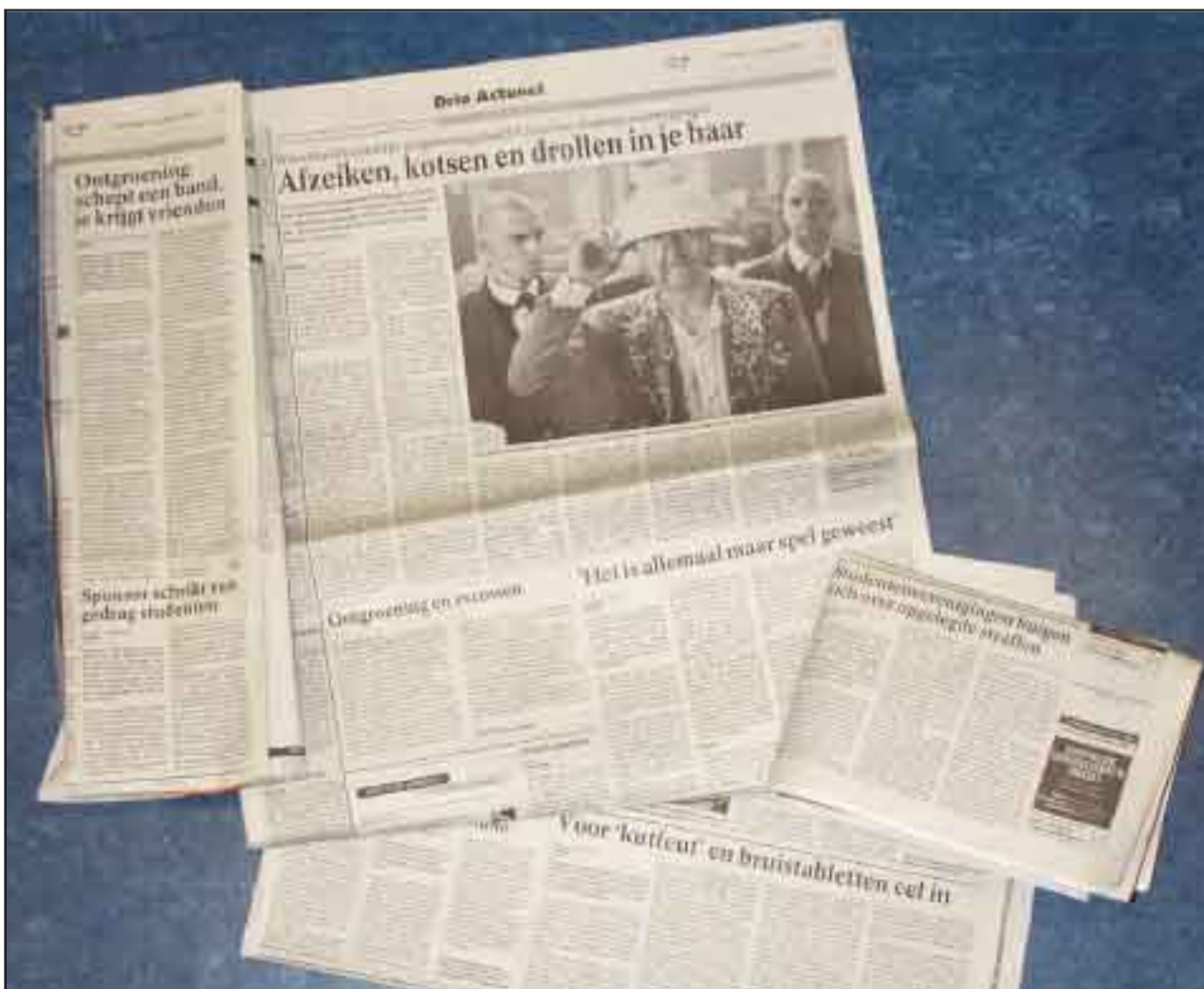
Deze artikelen waren het onderwerp van de Raad voor de Journalistiekzitting tussen Veritas en het Utrechts Nieuwsblad

De Raad voor de Journalistiek neemt nog vijf weken de tijd om tot een uitspraak te komen.