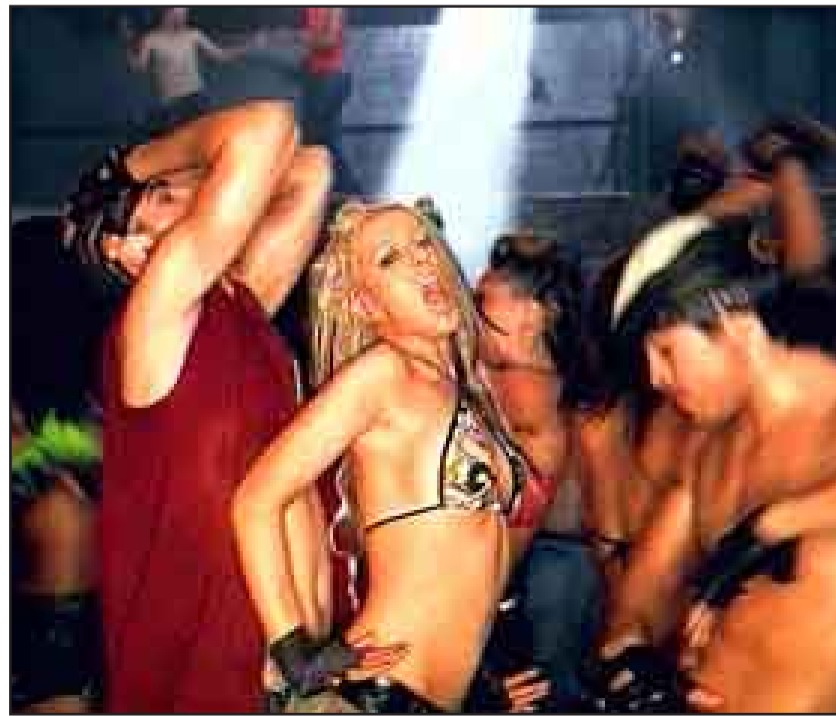
Leefbaar Nederland houdt niet van sexy videoclips