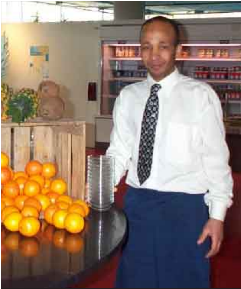
Een medewerker van het universiteitsrestaurant

Je kunt je diner opeten in de megagrote eetzaal van het restaurant. Het ziet er niet echt gezellig uit, maar het is schoon en verzorgd. De aardappeltjes van de dagschotel die ik mocht proeven, waren duidelijk de laatste van de schaal. Een beetje taai en koud. De biefstuk maakte het weer goed, net als de bloemkoolroosjes. De chocoladevla was prima en de appel onderweg naar huis smaakte ook oké. Er is genoeg keuze voor iedereen: frikadellen kosten 0,63 euro en voor 0,77 euro heb je een bakje patat. Ook zijn