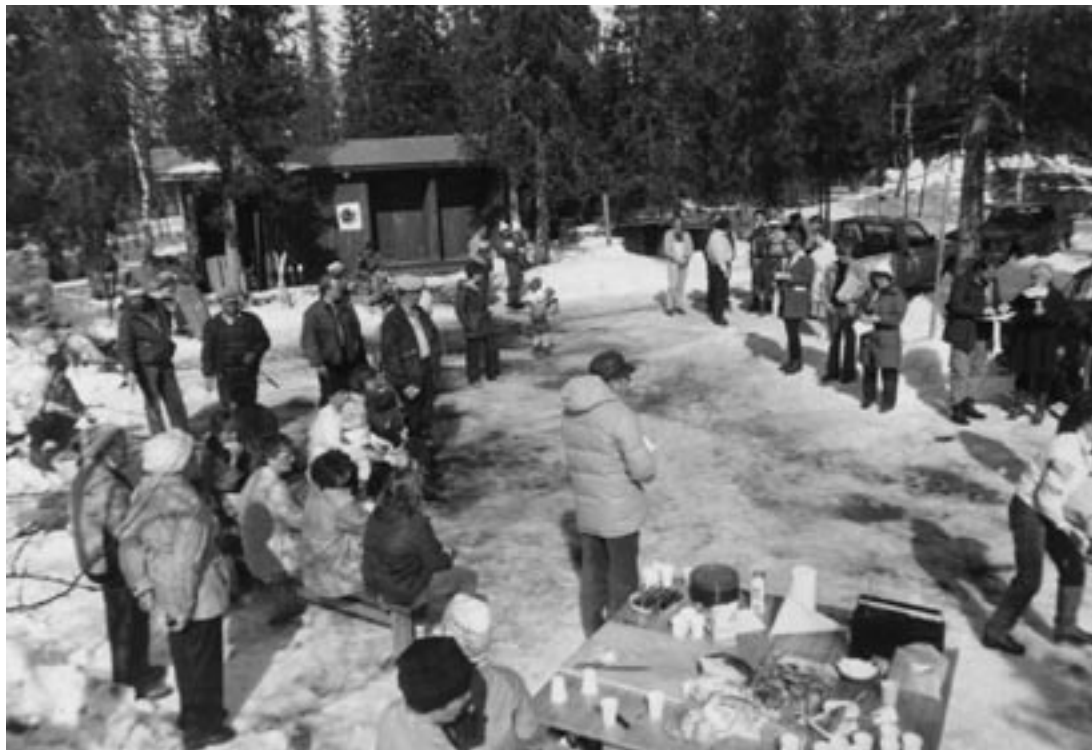
Muonion Ty:n vappujuhla 1980-luvun alussa.

Alkuajoista pitkälle yhdeksänkymmenluvulle valtaosa omien leirien osallistujista olivat nuoria tai nuoria aikuisia. Tämän jälkeen työttömien leirikonseptia laajennettiin koskemaan työttömiin yleensä ja ikärakenne muuttui. Osallistujat hankittiin pääosin lehti-ilmoituksin ja järjestöjen omia kanavia käyttäen. Monet järjestöt kuuluvat ns. kanta-asiakaskaartiin. Esimerkiksi pohjois-kar-