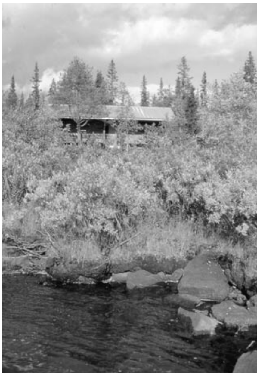
Pajukkoa rantasaunan edustalta.