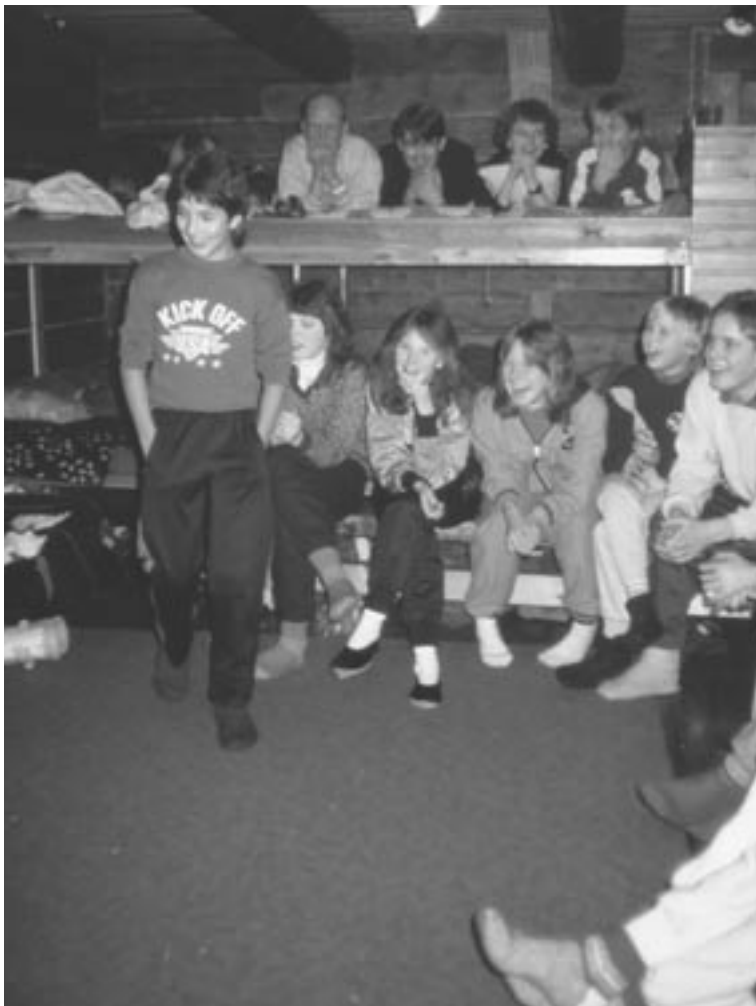
Helsingin Nuoret Kotkat hiihtoleirillä 90-luvun lopulla.

Suomen Ammattiin Opiskelevien Keskuliitto - SAKKI ry, on perustettu 1987, ammattiin opiskelevien edunvalvonta- ja palvelujärjestö. Jäseniä yli 80 000.