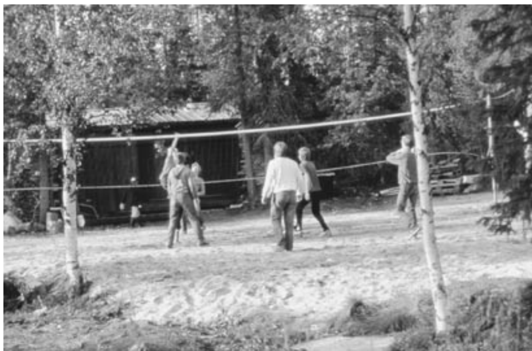
Leiriläisiä pelaamassa lentopalloa.