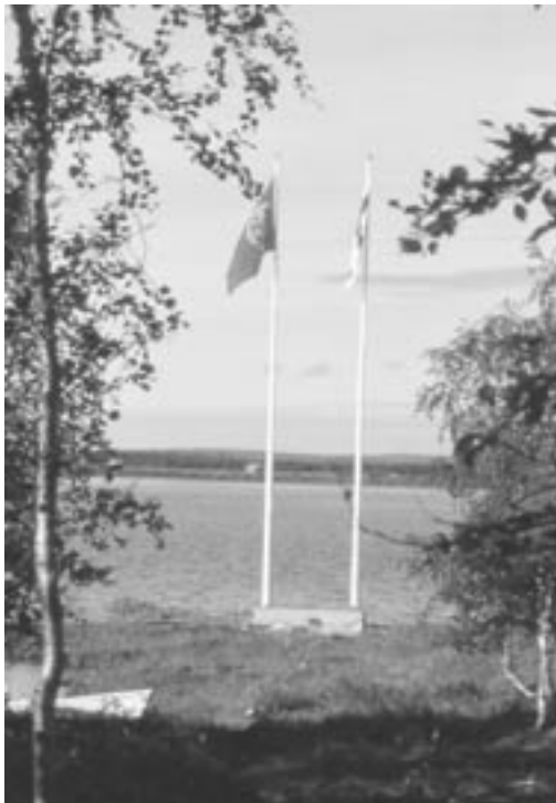
Liput salossa.

Työläisnuorten Tuki ry:llä on olemassa myös omaehtoista pääomaa, joka ei ole sidottu toisten normeihin. Se on vahvuus osajien verkostona ja sellaisen ylläpitäjänä. Menneet vuodet ovat osoittaneet, että muuttuneista työ- ja elämän tilanteista riippumatta, suuri joukko ihmisiä on yhteisin työponnistuksin saanut vuosien aikaan hyviä tuloksia. Työpanokset eivät ole yksinomaan keskittyneet vain yhdistyksen omiin tehtäviin. Monet polut yhteisestä arvopohjasta, osaamisesta ja tahdosta ovat johtaneet yhteiskunnalliseen vaikuttamiseen, kansalaisten, erityisesti nuorten aktivoimiseen mm. äänestysaktiivisuuden osalta. Uusi toimijapolvi, joka ottaa vastuuta yhdistyksestä, voi oppia menneistä virheistä, luoda uusia edellytyksiä syrjäytymisien estämiseksi, sekä kartuttaa itselleen ylläsanottua omaehtoista pääomaa.