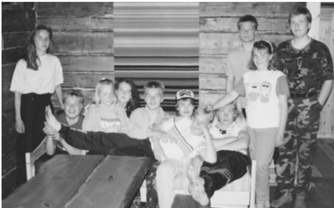
Leiriläisiä ryhmäkuvassa.

Vuonna -96 hallituksen pöytäkirja kertoo leiriohjelmien käsittelyn yhteyteen merkityistä leiritarvikkeista, joita kesän leireillä tarvitaan. Luettelo on melko mittava: vene ja moottori, kalaverkkoja, puu- ja metallityökaluja, pelastusliivejä, radio, teksti-tv, sekä vielä varmuudeksi sahoja ja kirveitä. Koska sadat ihmiset vuosittain käyttävät välineitä, niitä myös kuluu. Teksti-tv:n kohdalla oli lisäperusteena työttömän arkipäivän vähäinen jännitysmomentti, pitkäveto. Se ei näkynyt vanhoista höyrytelevisioista.