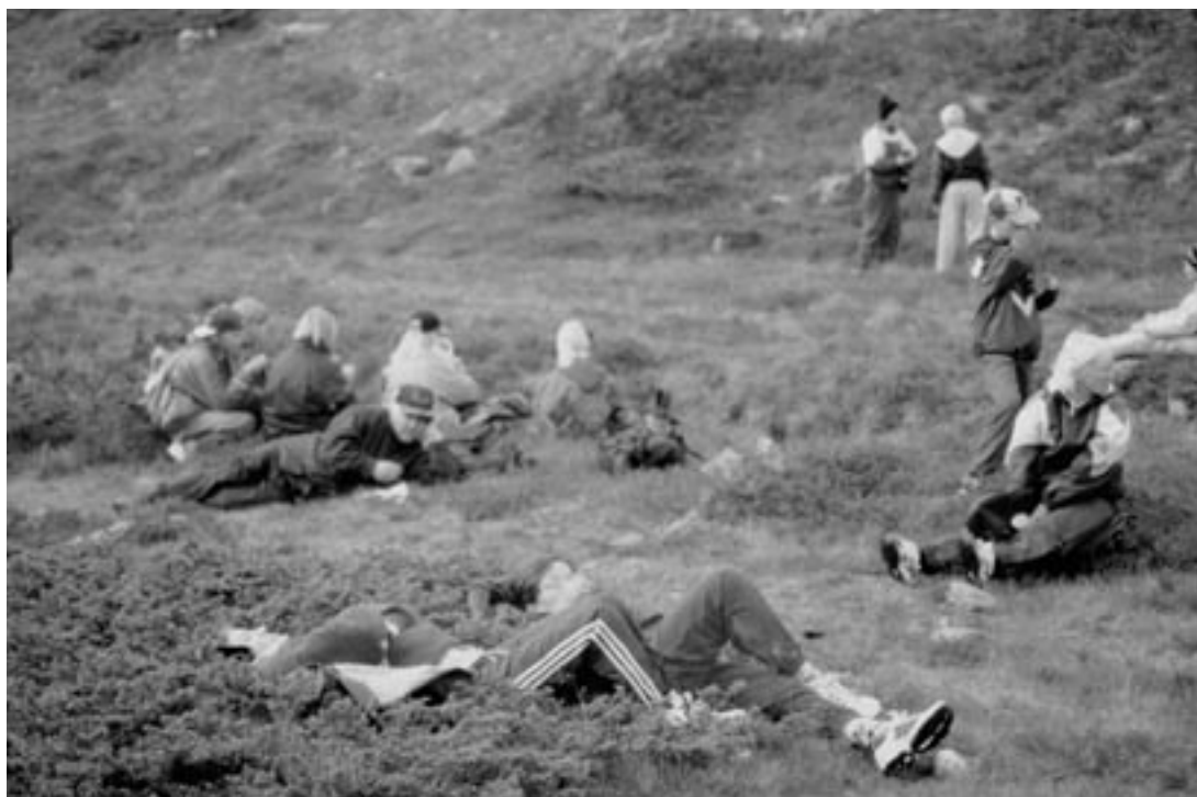
Roihuvuoren ala-asteen leirikoululaisia Pallaksella viettämässä taukoa 1996.

Hieman mittavammin yhdistys on osallistunut omaa toimintaansa sivuavien tapahtumien tukemiseen/osallistumiseen. Mm. SAK:n 75-vuotisjuhliin vuonna 1981 osallistuttiin tukemalla työläisnuorten osallistumista. Vuoden 1984 työläisnuorisopäivät ja seuraavan vuoden työläisnuorten konferenssi olivat tuen ja osallistumisen kohteena. Tampereen Festa- messuilla ja muissakin vastaavissa tilaisuuksissa pyöritettiin yhdistyksen toimintaa esittelevää hienoa diasarjaa. Kalevi Rajalan ottamat toiminta- ja luontokuvat puhuttelivat katsojia. Lippu-lehden kautta, etenkin juhluvuosina, yhdistys julkaisi ilmoituksen toiminnastaan. Kaikista mittavin tukimuoto, mihin pieni yhdistyksemme on yltenyt yksilötasolla on se, että perhe-, nuorten ja työttömien leirien