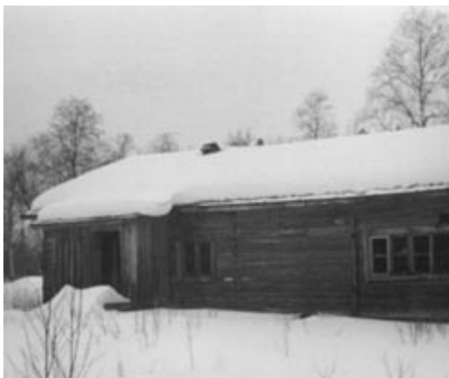
Metsähallituksen kämppä, joka purettiin päärakennuksen-hirsiksi. Toinen kämppä purettiin rauntasanaa varten ja varahirsiksi.

Innostunut talkootyö muoniolaisten toimesta johti sanoista tekoihin. Vuonna 1976 kämpän perustan valutalkoiden jälkeen alkoi pääpirtin pystytys. 1977 syksyllä pidettiin kylänväen ja rakentajien harjakaiset. Vauhdikas alku pakotti myös SNK:n terävän pään pohtimaan, miten tällainen kämppäprojekti oikeastaan sisällytetään liiton omaan toimintaan. Kuinka paljon se vie liiton hallinnon aikaa? Anotaanko mahdollisia avustuksia liitolle ja kämpälle jostakin? Entä velat ja vastuut? Meneekö puurot ja vellit sekaisin? Tämä pohdinta johtikin ajatukseen perustaa uusi, erillinen tukiyhdistys jatkamaan kämppäprojektia ja suunnittelemaan sen tulevan toiminnan sisältöä.