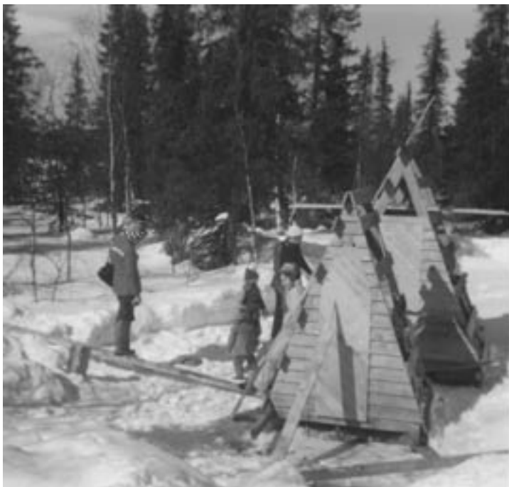
Ensimmäiset kenttäkäymälät 1977.