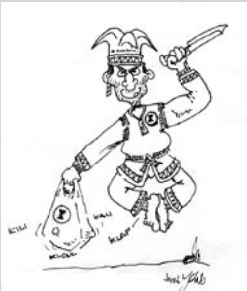
Tuntemattoman taiteilijan tv:n suosikkisarjan "Pulttiboysin" innostama lapin kuva vieraskirjasta.

Jo vuonna 1987 oli vuorossa toinen paritalo, hieman paranneltu malli, joka sai myös RAY:n siunauksen ja valmistui rivakasti. Tilustien heikon kantavuuden takia hallitus päätti tilata hiekat talvikelin aikana.