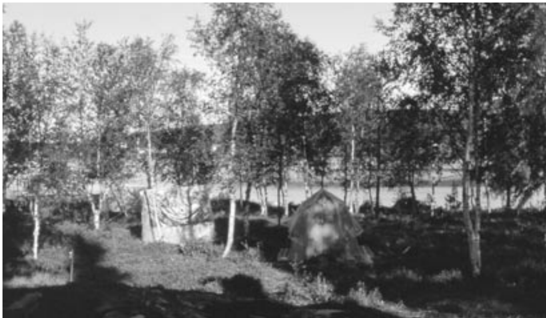
Alkukauden leirien majoitus hoidettiin pääasiassa teltoilla.

Toinen avustussuunta oli Raha-automaattiyhdistys. Yhdistyksemme toimintaideaa ja aikaansaannoksia pidettiin hyväksyttävänä. Hyväksyntäpäätös päästä a-listalle oli myönteinen yllätys. 90-luvulla hyväksyimme siirron c-listalle. A-avustus oli siitä hyvä, että avustusta voi käyttää nimetyn hankkeen lisäksi myös muihin hyväksyttäviin toimintakuluihin. Vaikka avustukset olivat pieniä, niin niiden turvin kykenimme kehittämään erityisesti nuoriin kohdis-