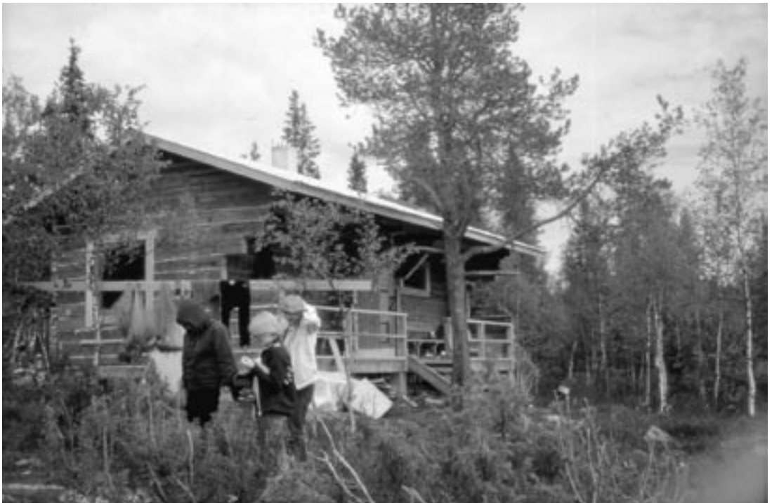
Leiriläisiä vasta valmistuneen rantasaunan "ryteikössä".

Muoniolaisten talkoovoimavarat oli kulutettu lähes loppuun. Nyt päätettiin kutsua nuoret apuun. Vuonna 1978 pidettiin SNK:n retkeilypäivät Muoniossa. Perusrakentaminen painoi päälle, jotta nuoret voivat tulla paikalle jatkamaan