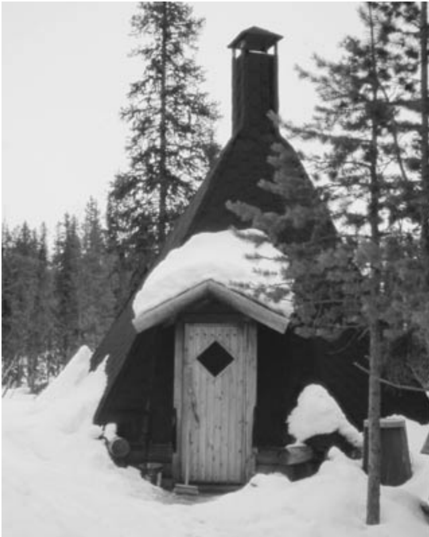
1990 -luvulla rakennettu kota.