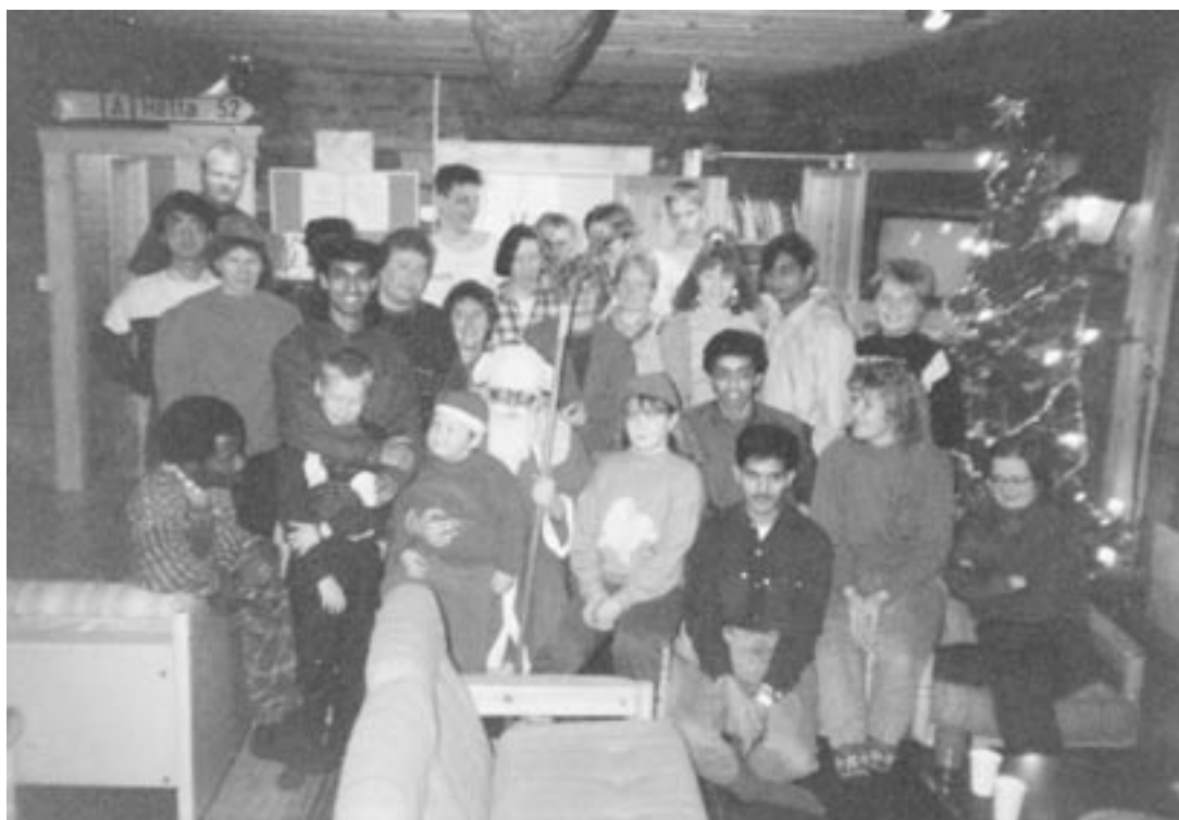
Joululeirin kansainvälistä porukkaa.