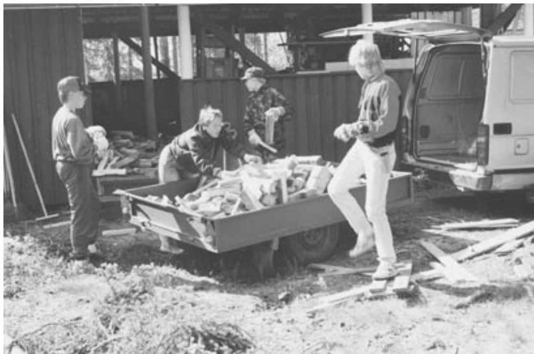
Polttopuiden teko on kuulunut vuosittaiseen leirityöhön.

Vuonna 1994: "Nykyisessä yhteiskunnallisessa murroksessa yhdistyksen toiminnalliset tavoitteet korostuvat. Erityisesti nuoret ovat se osa kansasta, joiden etuja voidaan helpoimmin heikentää ja elämisen edellytyksiä kaventaa ilman, että juuri mikään taho näkyvästi nousisi niitä puolustamaan. Tässä huolestuttavassa tilanteessa yhdistyksen tavoitteet tarjota vähäosaisille nuorille mahdollisuuksia omatoimiseen koulutus-, kurssi- sekä leiri- ja retkeilytoimintaa ovat hyvin perusteltuja ja kaiken tuen ansaitsevia."