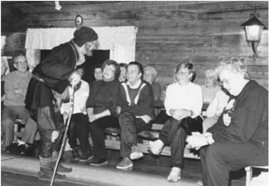
Lapinkaste kuuluu monen ensikertalaisen pakollisiin rituaaleihin.