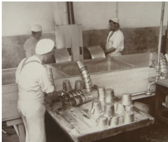
Ústavní pekárna a mechanizovaná linka pro umývání nádobí ve věznici Plzeň-Bory

Pouze tři z jedenácti receptur ve věznicích vyvařovaných polévek neobsahovaly alespoň pětigramový přídavek zeleniny. K přípravě pokrmů byly využívány především dobře skladovatelné druhy zelenin spolehlivé svým výnosem jako zelí, kapusta, mrkev, cibule, česnek, fazole, kopr, ale i okurky, rajčata a díky možnosti vynaložit dostatek ruční práce i kedlubny. Ve směsi se v pokrmech užívala mrkev, dýně, tuřín, vodnice, špenát a dokonce i žlutá řepa, červená řepa, hlávkový salát, který byl podáván jako „celojídlo“ v množství 400g se solí a octem. Pokud sloužil za přílohu k hlavnímu jídlu, bylo jej jen poloviční množství. Zeleniny se upravovaly většinou v dušeném stavu zahuštěné jíškou i v kombinaci jednotlivých zelenin a brambor. Na 1 porci mělo být využito 300g až 600g nečištěné zeleniny.