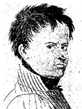
Dobová vyobrazení J. J. Grasela

Text zatykače na J. J. Grasela z 9. listopadu 1815